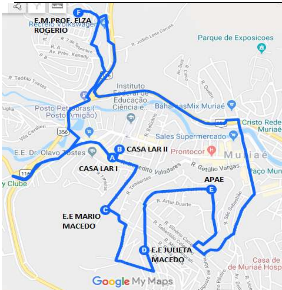
Imagem 3: Projeto Executivo da linha Muriaé / Casa Lar - Escolas