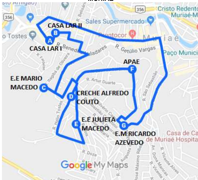
Imagem 2: Projeto Executivo da linha Muriaé / Casa Lar – Escolas

Memorial Descritivo: O trajeto principal composto de todos os pontos inicia-se no ponto A na Casa Lar I em destino ao ponto B na Casa Lar II onde coleta alunos, segue do ponto B ao ponto C E.E Mário Macedo no Bairro da Barra onde deixa alunos, segue do ponto C ao ponto D na Creche Alfredo Couto onde deixa alunos, segue do ponto D ao ponto E na E.E Julieta Macedo situado no bairro Planalto deixa alunos, segue do ponto E ao ponto F na APAE onde deixa alunos, segue do ponto F ao ponto G na E.M Ricardo Azevedo situado no Bairro Safira onde deixa alunos, retorna do ponto G ao ponto A e B, situado na Casa Lar I e Casa Lar II, percorrendo um Projeto básico/Trajeto de 6,64 Km.