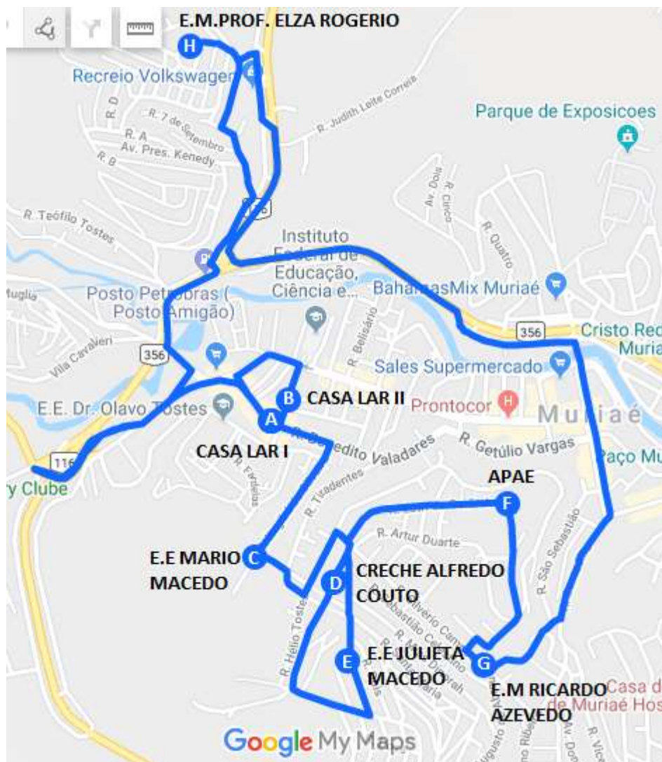
Imagem 1: Projeto Básico da linha Muriaé / Casa Lar – Escolas