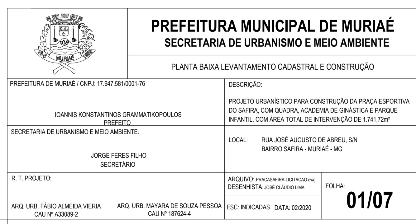
PLANTA BAIXA - CONSTRUÇÃO ESC 1:125