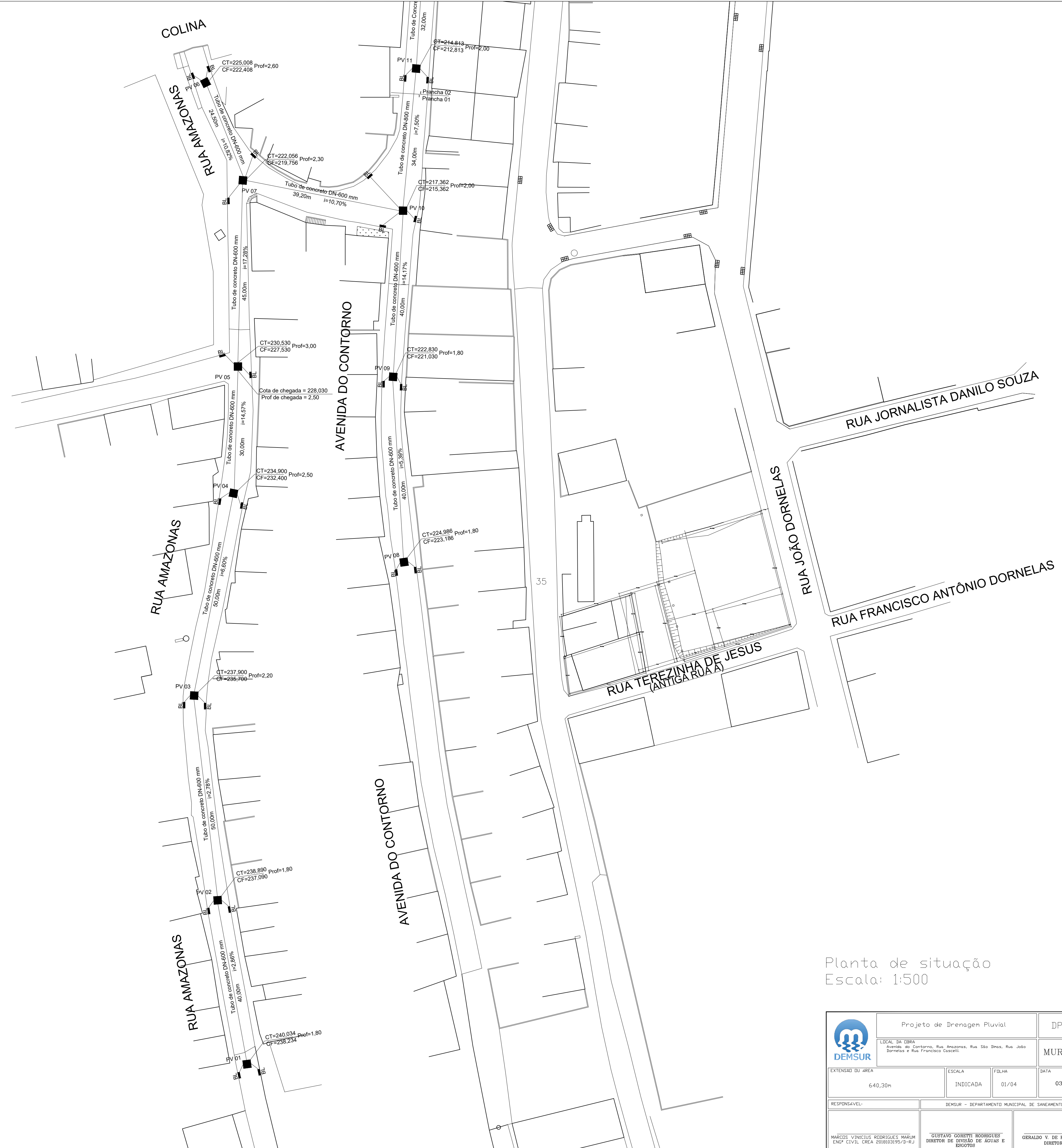
Planta de situação Escala: 1:500