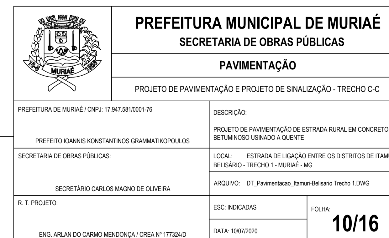
PROJETO DE SINALIZAÇÃO - TRECHO C-C ESC: 1/500