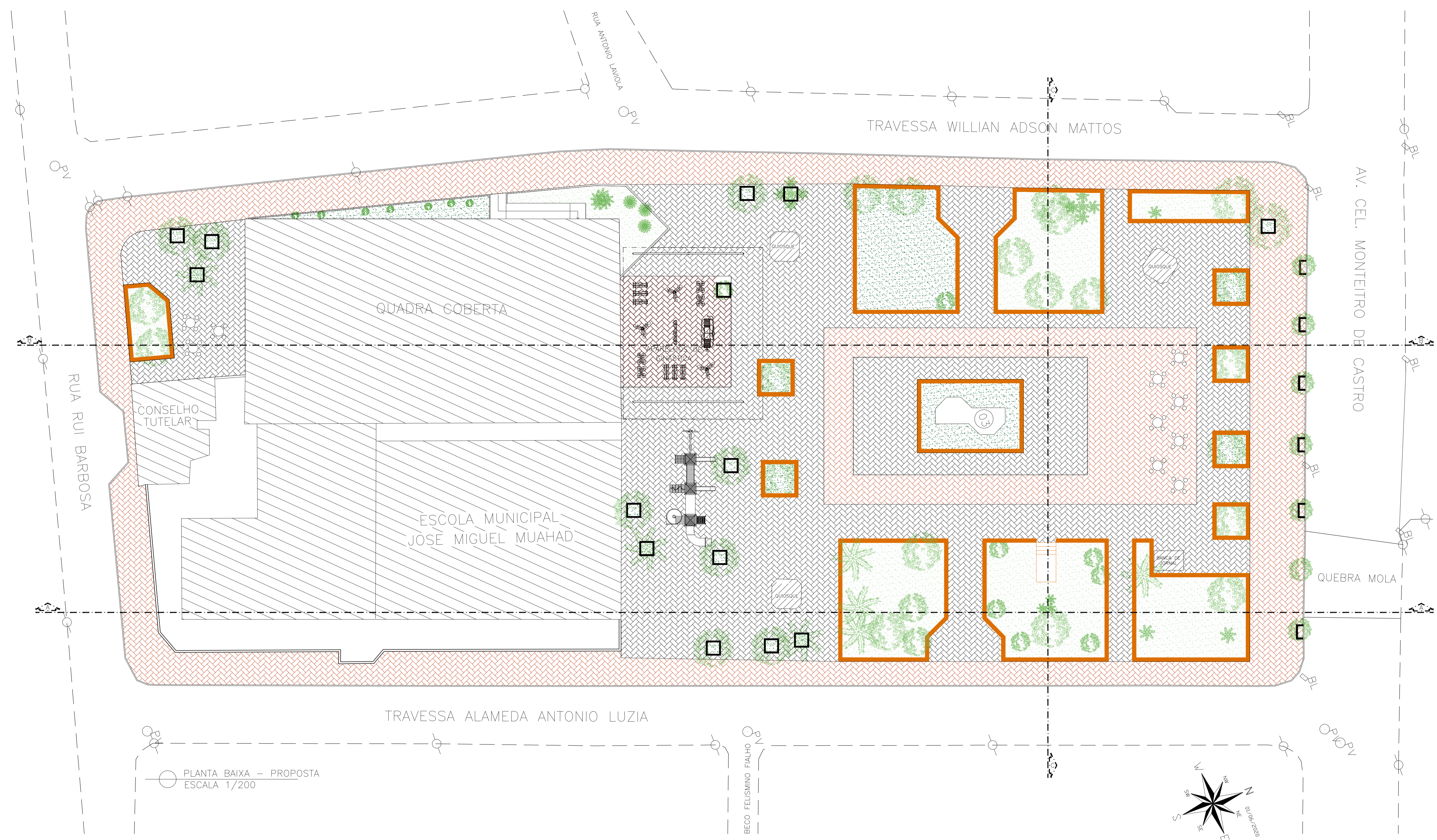
PLANTA BAIXA - PROPOSTA ESCALA 1/200