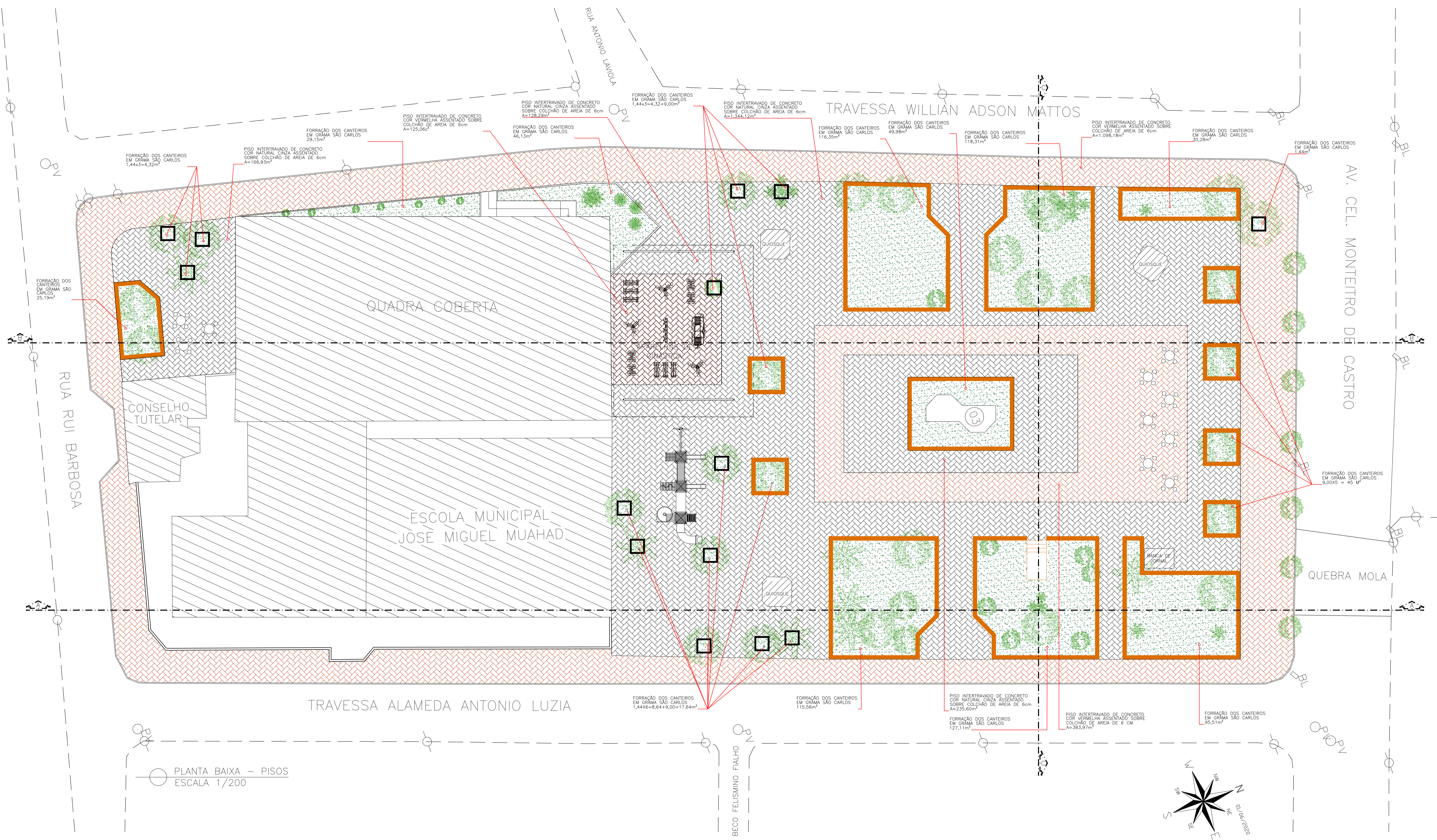
PLANTA BAIXA – PISOS ESCALA 1/200