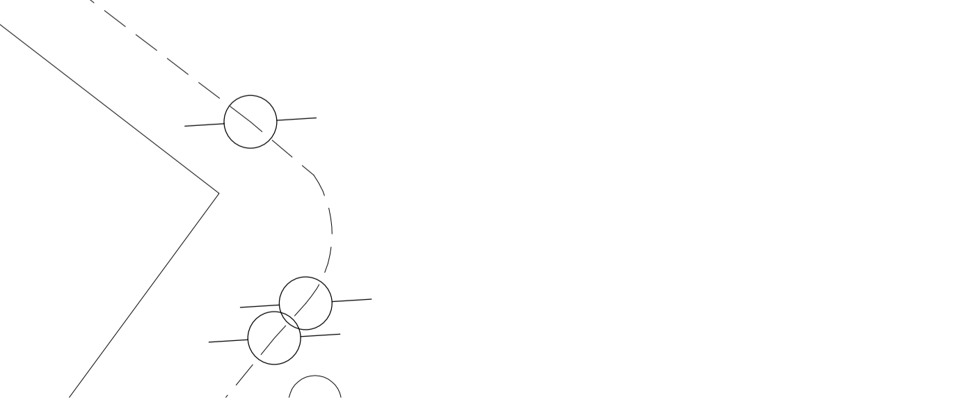
PLANTA BAIXA - PROPOSTA ESC: 1:100