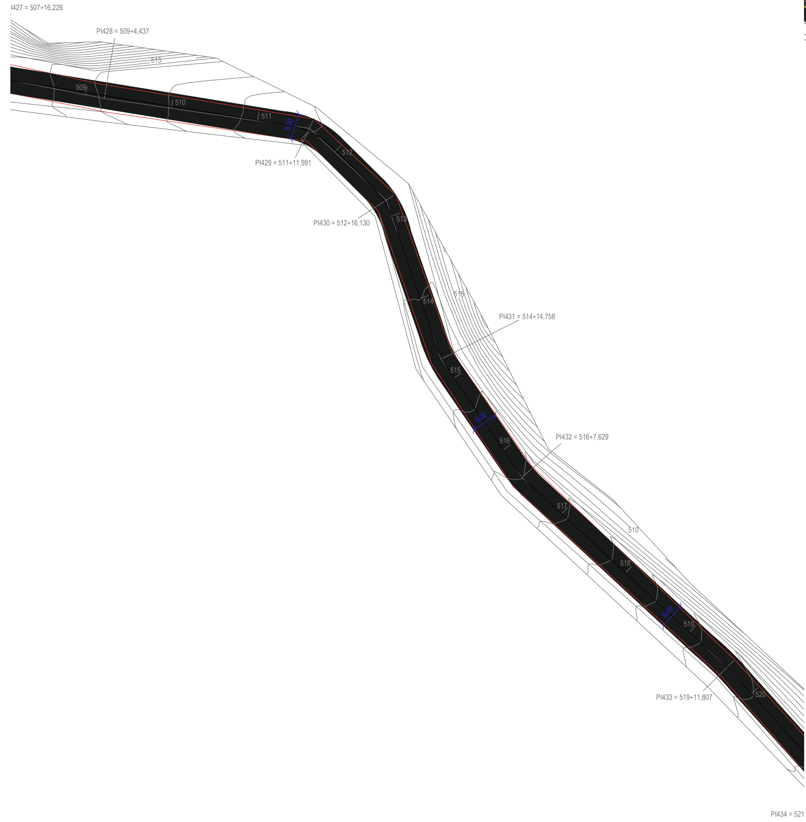
PROJETO DE PAVIMENTAÇÃO - TRECHO E-E ESC: 1/500