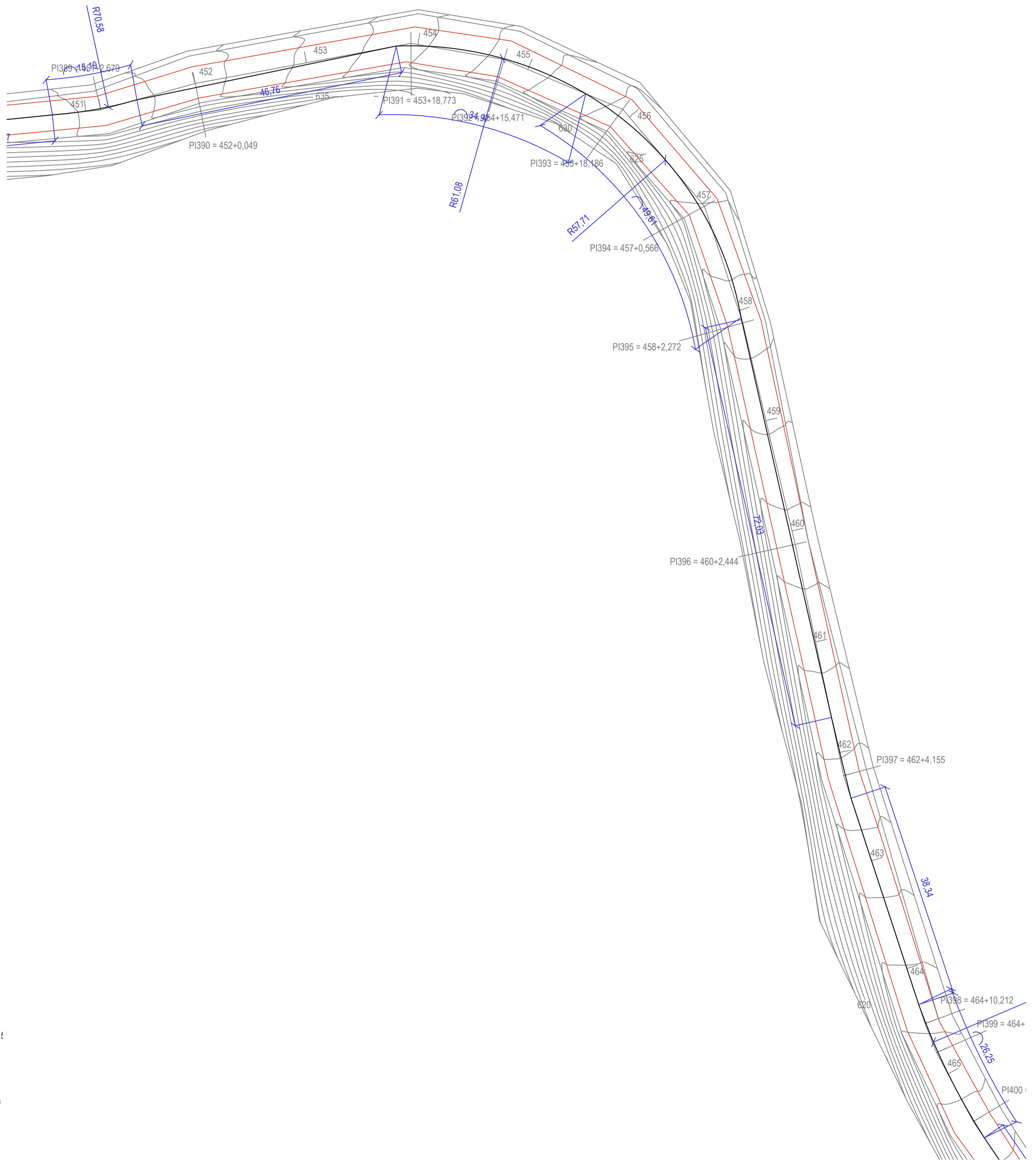
LEVANTAMENTO TOPOGRÁFICO PLANIATIMÉTRICO - TRECHO J-J ESC: 1/500