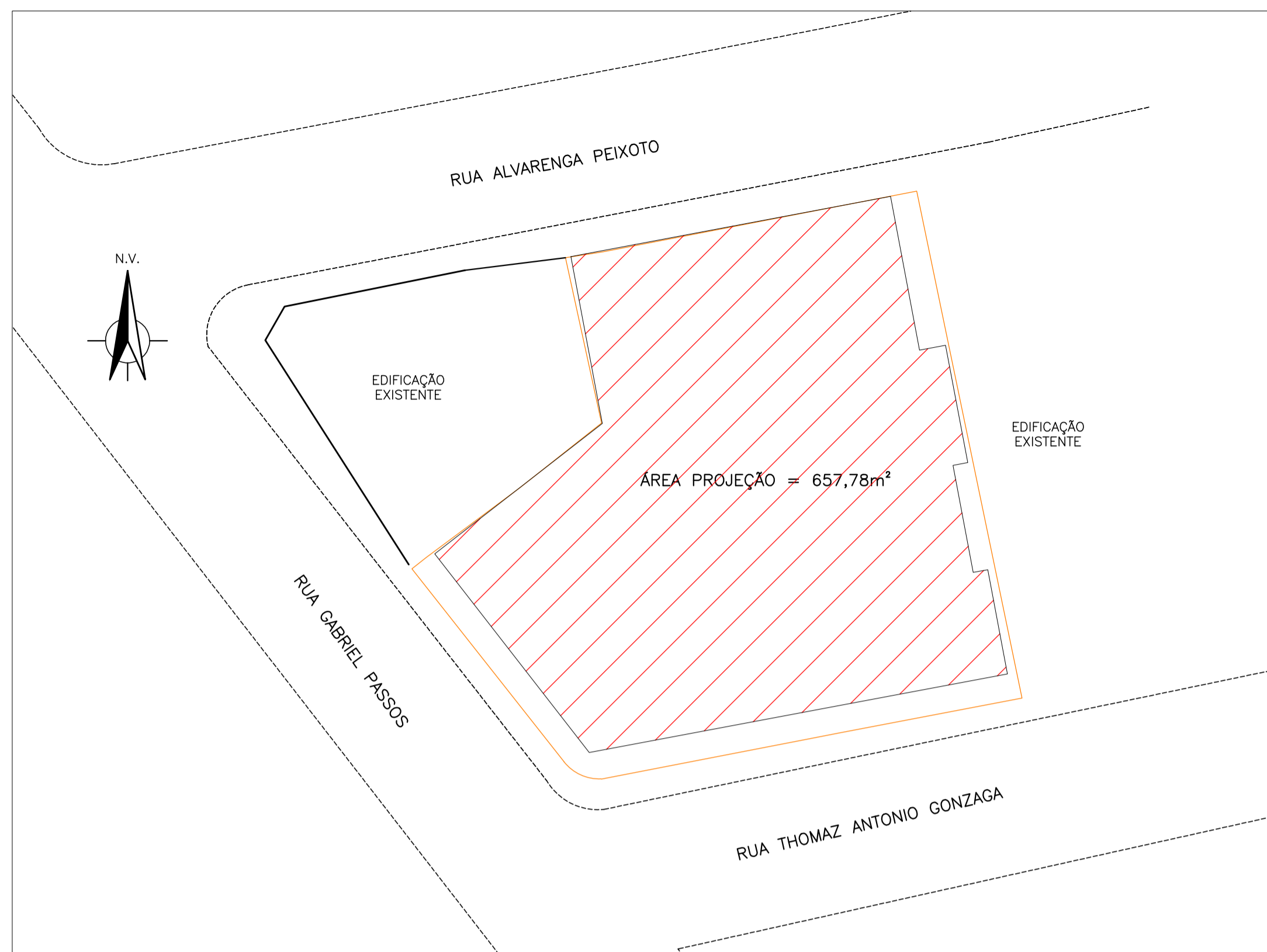
SITUAÇÃO ESCALA 1:250