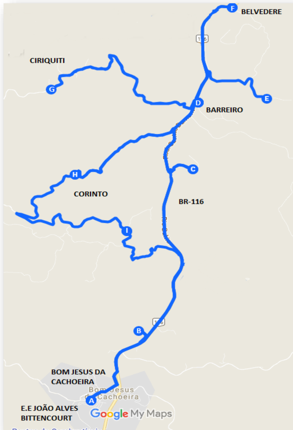
Imagem 4: Projeto Executivo da linha Bom Jesus da Cachoeira – Barreiro e Adjacências.