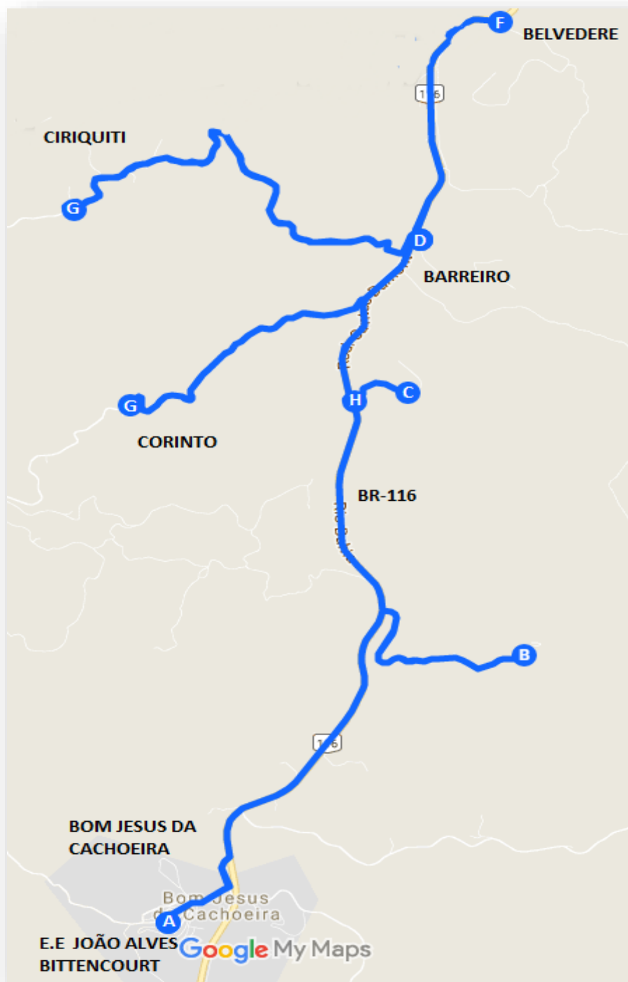
Imagem 2: Projeto Executivo da linha Bom Jesus da Cachoeira – Barreiro e Adjacências.