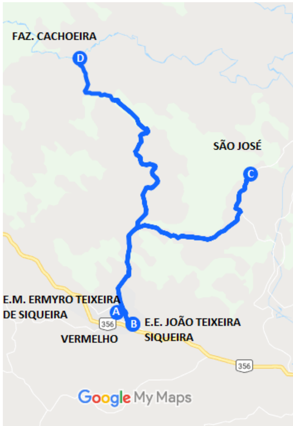
Imagem 3: Projeto Executivo da linha Vermelho – Vermelho e São José.