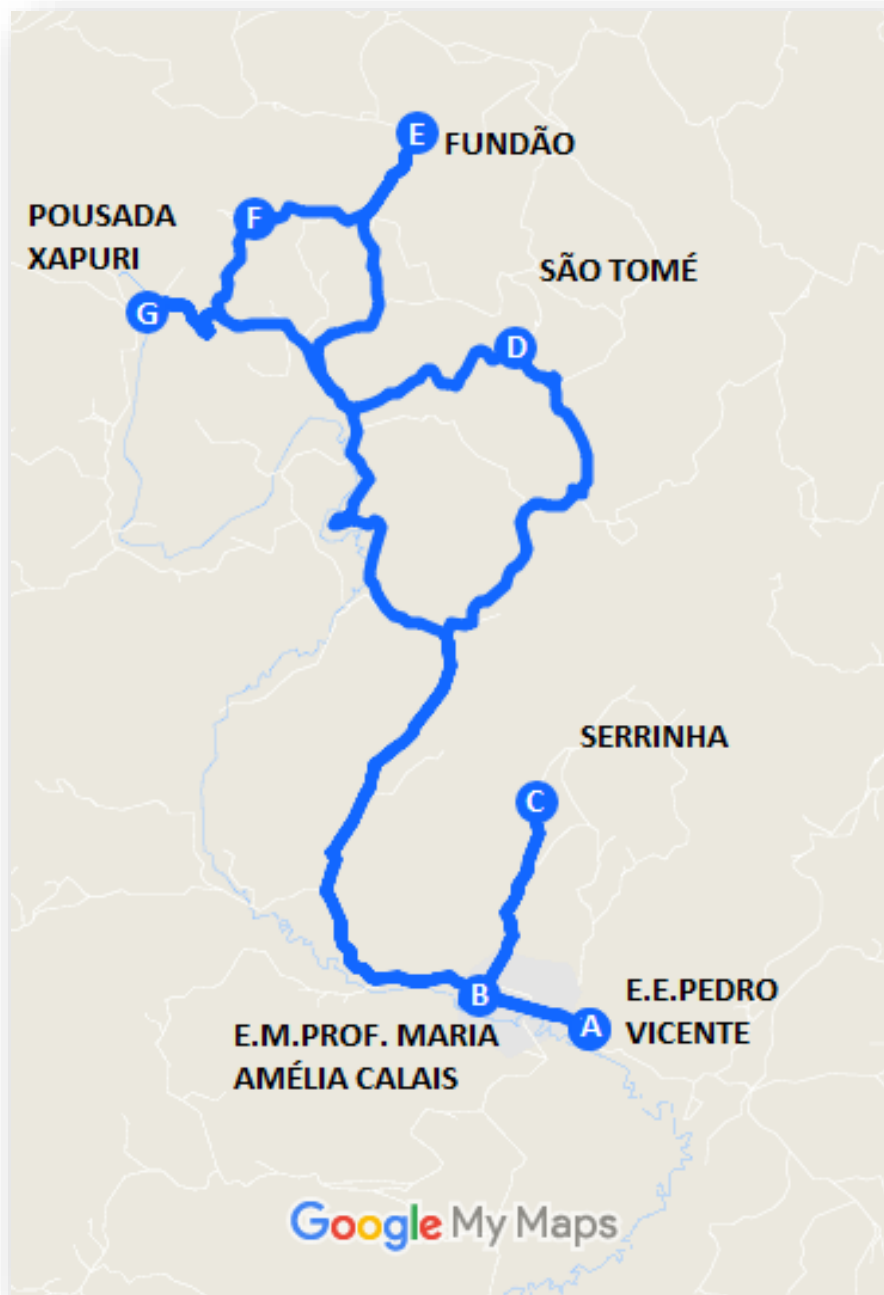
Imagem 3: Projeto Executivo da linha Belisário – Serrinha – Fundão – São Tomé e Adjacências.

Distância percorrida: 21,89 Km por trajeto, sendo executado uma vez por dia no horário de 05:30 às 07:00hs. Resultando em um Projeto executivo parcial de: 21,89 Km/dia.