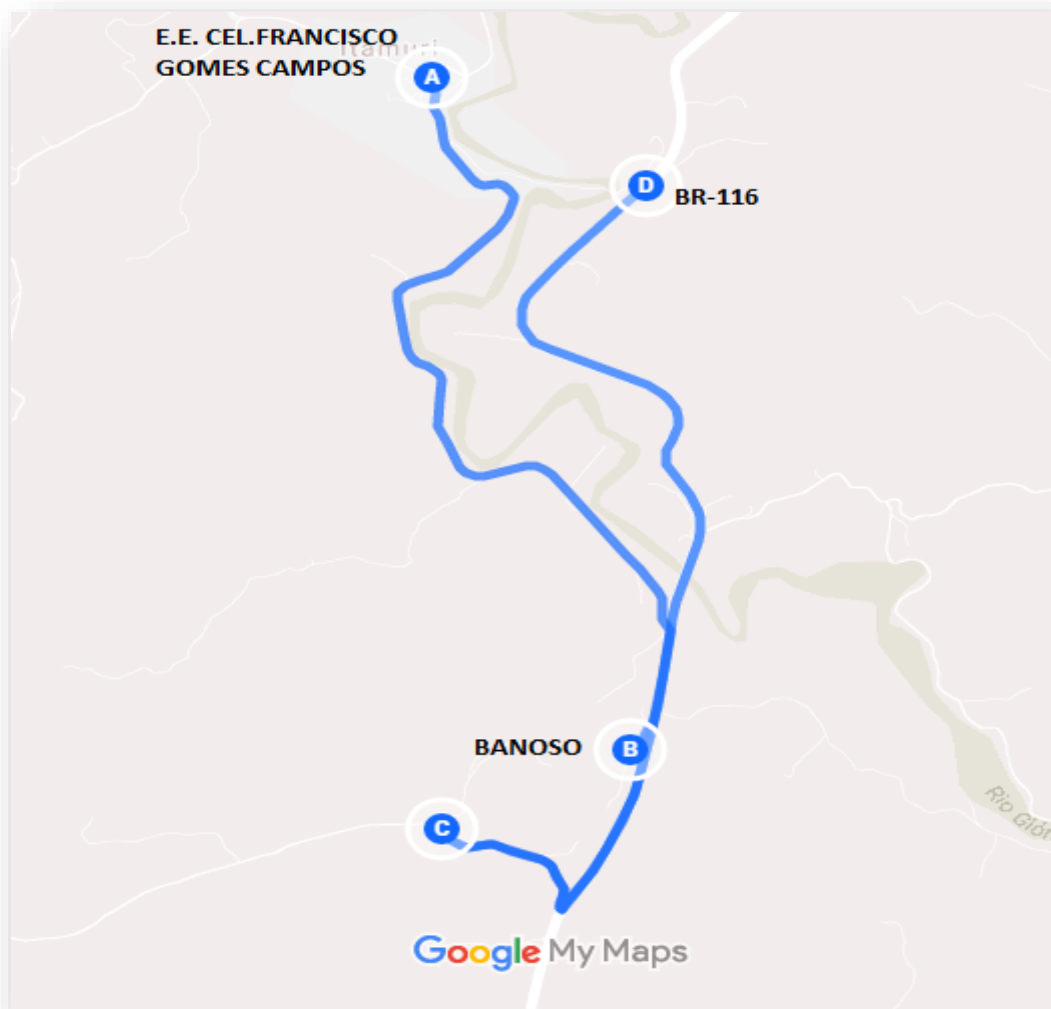
Imagem 2: Projeto Executivo da linha Itamuri – Capetinga - Usina interno I