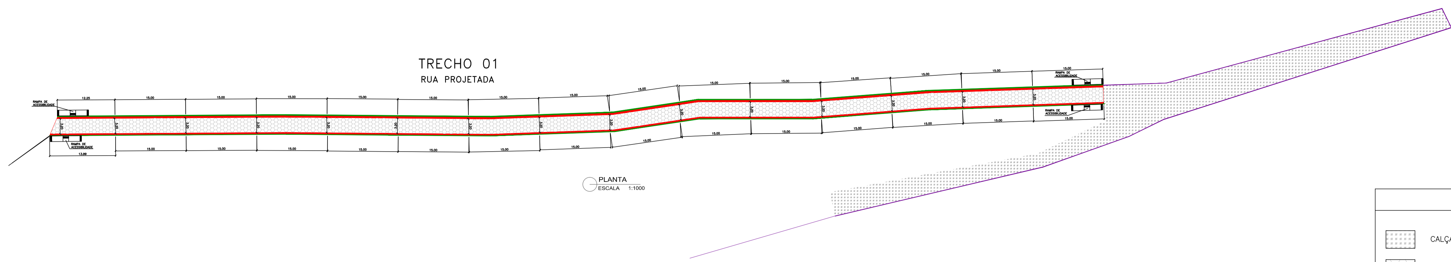
PLANTA ESCALA 1:1000