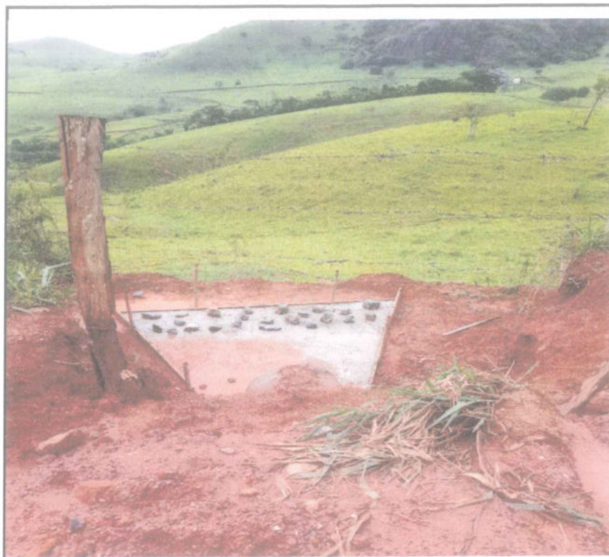
Foto 08 - ESTACA 86 + 10,00 - BUEIRO - ESCAVAÇÃO E REATERRO DESLIZAMENTO DE TALUDE