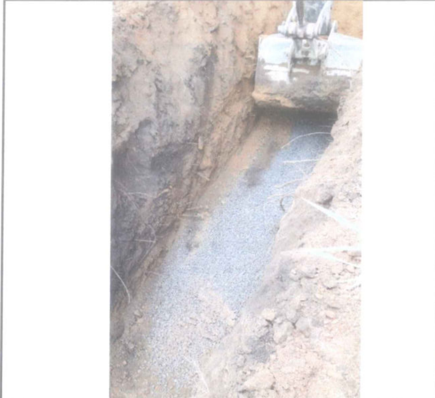
Foto 01 - Escavação de vala mecanizada e execução de fundo de vala em brita.