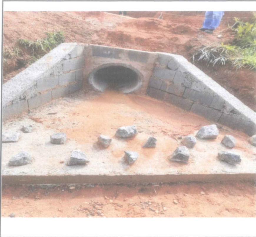
Foto 09 - ESTACA 105 - ESCAVAÇÃO E REATERRO MAT. 1ª CATEGORIA - BUEIRO - CAIXA E BOCA.