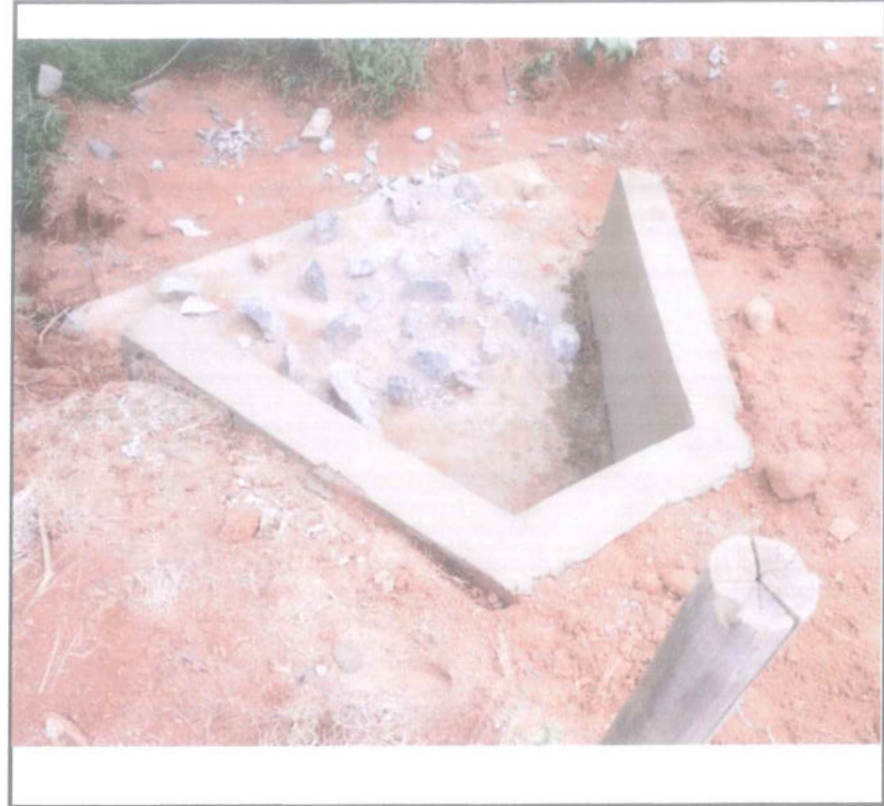
Foto 10 - BOCA E DISSIPADOR.