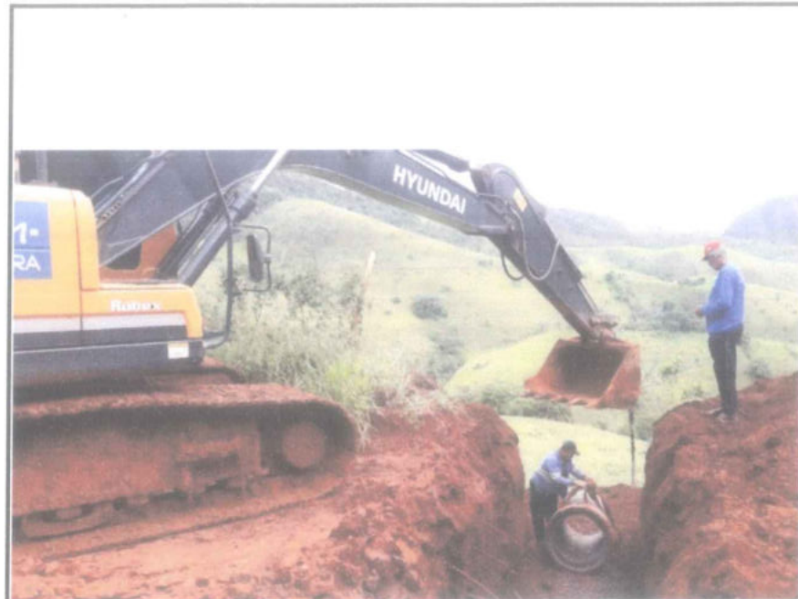
Foto 04 - Escavação, execução de fundo de base em brita e assentamento de tubo de concreto.