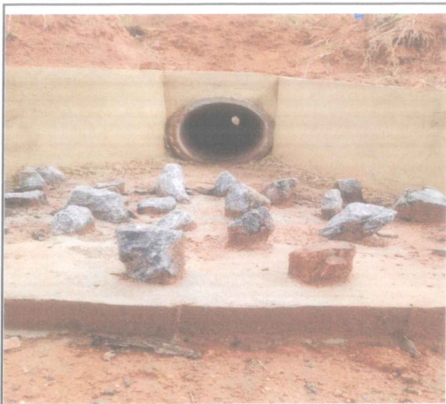
Foto 07 - ESTACA 32 - ESCAVAÇÃO E REATERRO MAT. 1ª CATEGORIA - BUEIRO COM CAIXA E BOCA - DISSIPADOR.