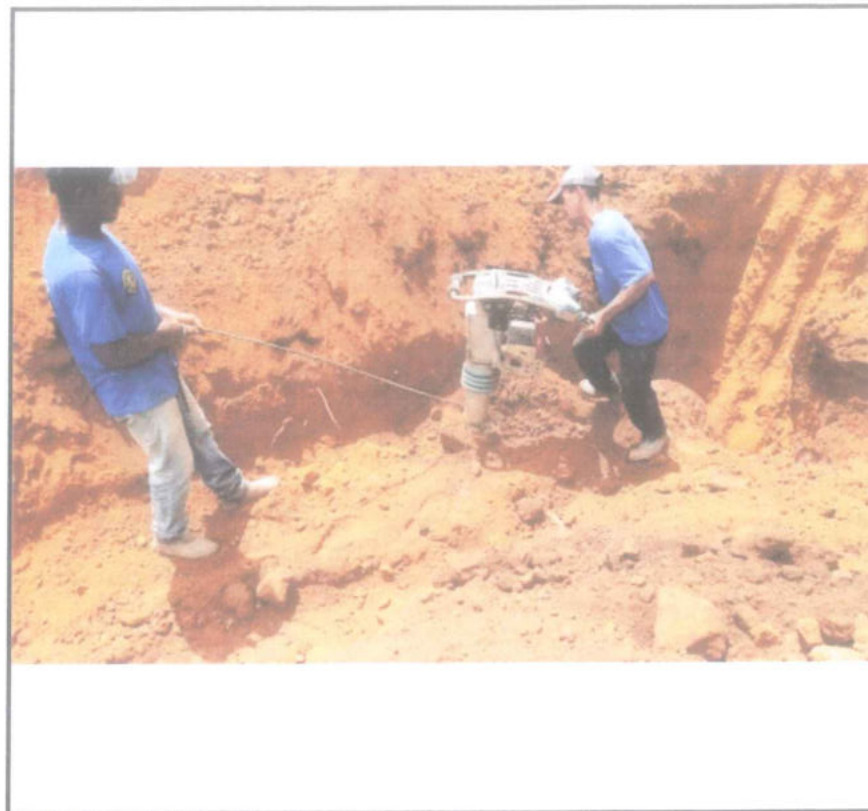
Foto 06 - Execução de reaterro de vala e compactação.