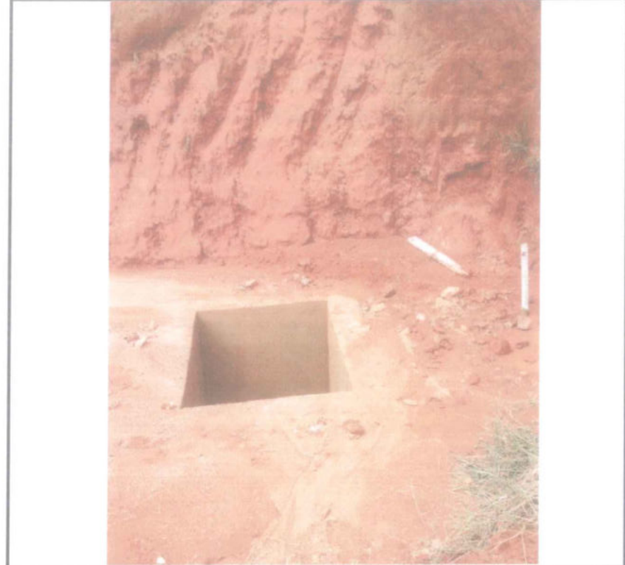
Foto 02 - Execução de boca de lobo.