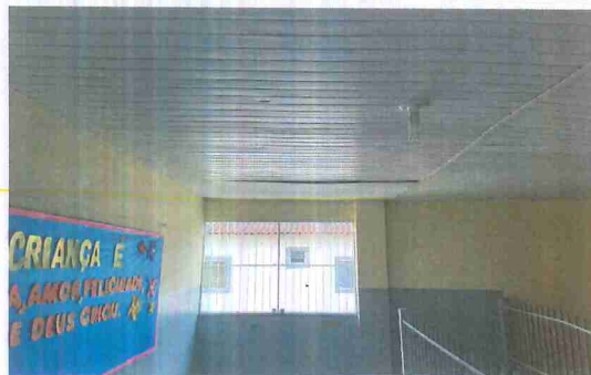
IMAGEM 1: REFORMA DA E.M. PROF. TEREZINHA M. O. RIBEIRO LOCAL: FORRO PVC 2 PAVIMENTO