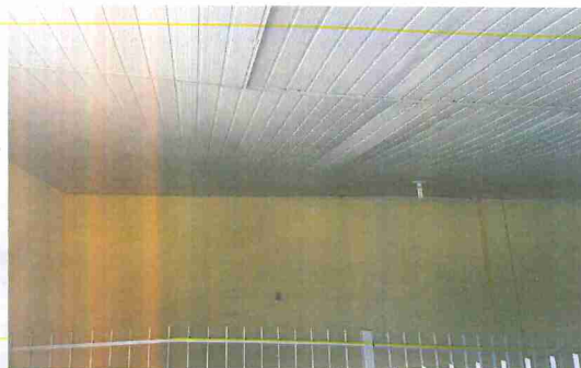
IMAGEM 2: E.M. PROF. TEREZINHA M. O. RIBEIRO LOCAL: FORRO PVC 2 PAVIMENTO