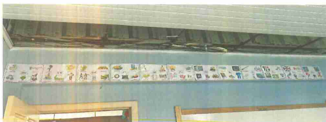
IMAGEM 3: REFORMA DA E.M. MARIA ALELUIA S. BITTENCOURT LOCAL: TERRAÇO