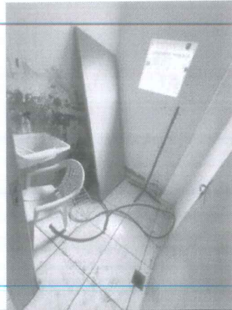
IMAGEM 4: MANUTENÇÃO CENTRO DE CONVIVÊNCIA LOCAL: DORNELAS II