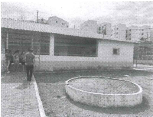
IMAGEM 1: MANUTENÇÃO CENTRO DE CONVIVÊNCIA LOCAL: DORNELAS II