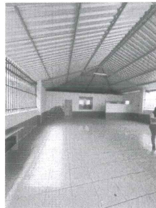
IMAGEM 2: MANUTENÇÃO CENTRO DE CONVIVÊNCIA LOCAL: DORNELAS II