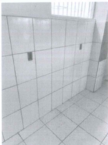
IMAGEM 5: MANUTENÇÃO CENTRO DE CONVIVÊNCIA LOCAL: DORNELAS II