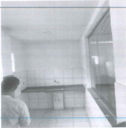
IMAGEM 3: MANUTENÇÃO CENTRO DE CONVIVÊNCIA LOCAL: DORNELAS II