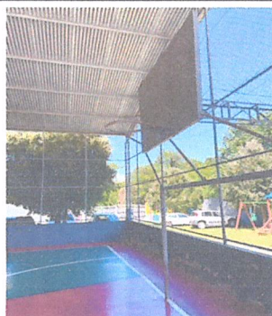
IMAGEM 1: REFORMA E.M. IONYR BASTOS DIAS LOCAL: QUADRA