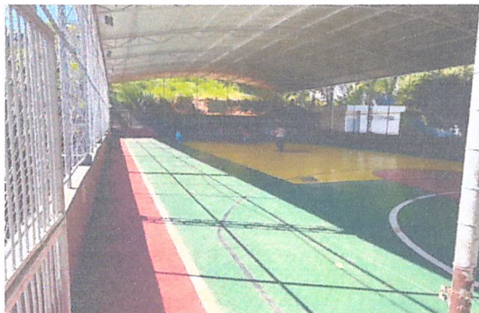
IMAGEM 3: REFORMA E.M. IONYR BASTOS DIAS LOCAL: QUADRA