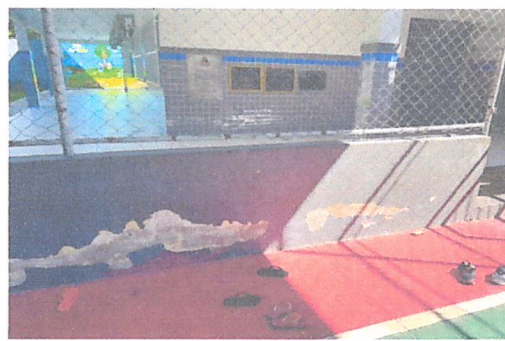
IMAGEM 2: REFORMA E.M. IONYR BASTOS DIAS LOCAL: QUADRA