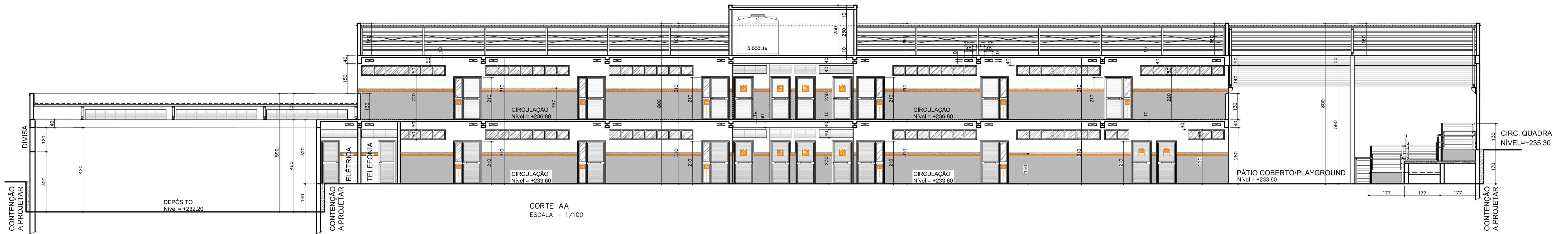
CORTE AA ESCALA - 1/100