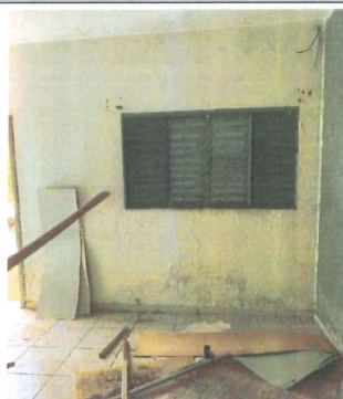
IMAGEM 2: PINTURA LOCAL: REFORMA ANTIGO POSTO POLICIAL - BELISARIO