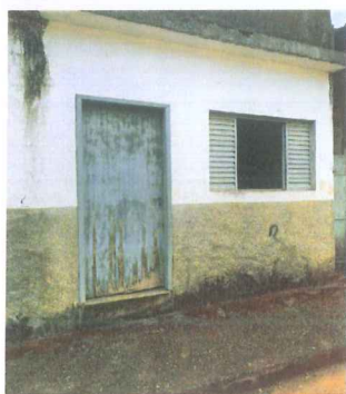
IMAGEM 1: PORTA DE MADEIRA E PINTURA LOCAL: REFORMA ANTIGO POSTO POLICIAL - BELISARIO