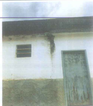
IMAGEM 3: PINTURA