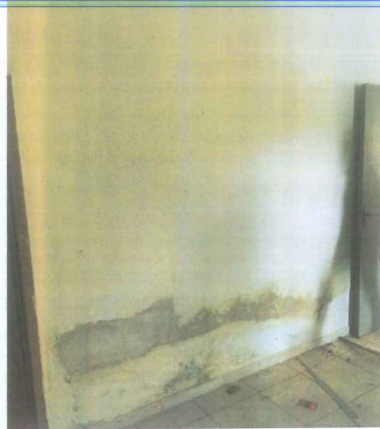
IMAGEM 5: REFORMA BANHEIRO