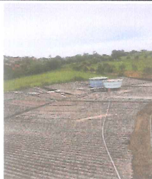
IMAGEM 2: MANUTENÇÃO JARDIM DA PAZ LOCAL: GASPÁR