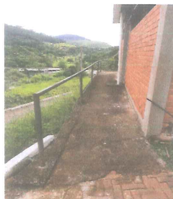
IMAGEM 5: MANUTENÇÃO JARDIM DA PAZ LOCAL: GASPAR