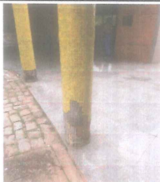
IMAGEM 1: MANUTENÇÃO JARDIM DA PAZ LOCAL: GASPÁR