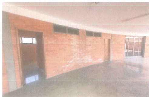
IMAGEM 3: MANUTENÇÃO JARDIM DA PAZ LOCAL: GASPAR