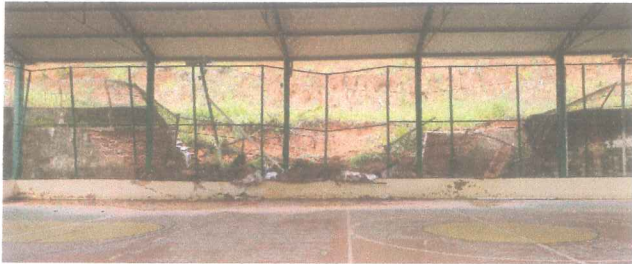
IMAGEM 1: QUADA POLIESPORTIVA, DANOS CAUSADOS PELA CHUVA LOCAL: SANTANA