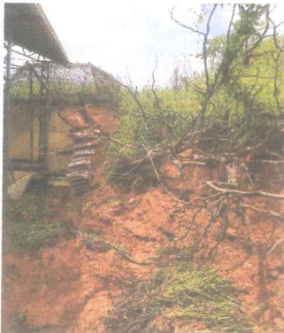
IMAGEM 3: QUADA POLIESPORTIVA, DANOS CAUSADOS PELA CHUVA LOCAL: SANTANA