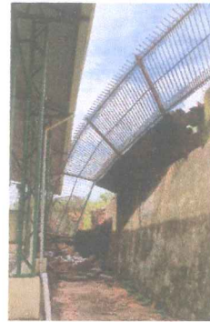
IMAGEM 2: QUADA POLIESPORTIVA, DANOS CAUSADOS PELA CHUVA LOCAL: SANTANA