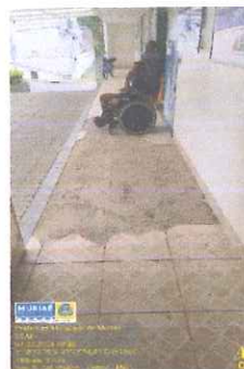
IMAGEM 5: MANUTENÇÃO DO CENTROS ESTADUAIS DE ATENÇÃO ESPECIALIZADA 1ª ETAPA LOCAL: RUA CORONEL IZALINO