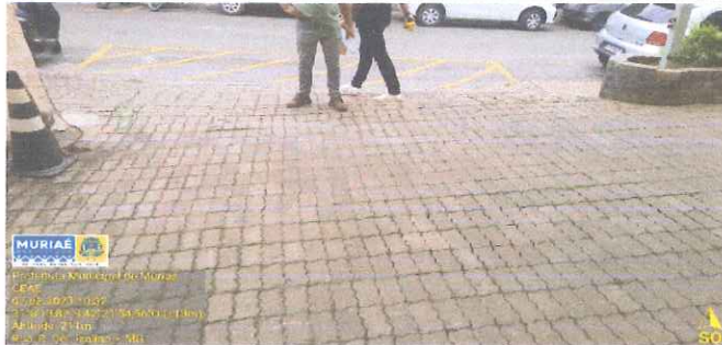
IMAGEM 1: MANUTENÇÃO DO CENTROS ESTADUAIS DE ATENÇÃO ESPECIALIZADA 1ª ETAPA LOCAL: RUA CORONEL IZALINO