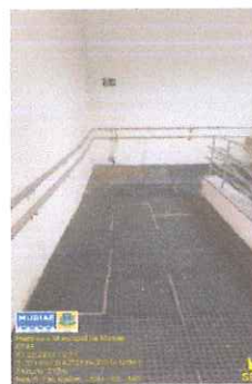
IMAGEM 3: MANUTENÇÃO DO CENTROS ESTADUAIS DE ATENÇÃO ESPECIALIZADA 1ª ETAPA LOCAL: RUA CORONEL IZALINO