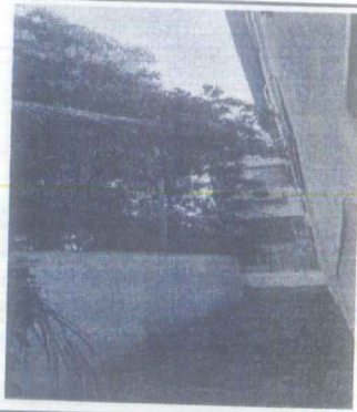
IMAGEM 3: E.M. ZULEIMA CESAR ARAUJO LOCAL: MURO DE DIVISA