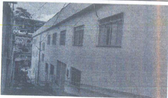
IMAGEM 1: E.M. ZULEIMA CESAR ARAUJO LOCAL: FACHADA PARA TRAVESSA