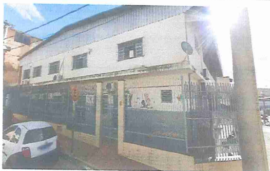
IMAGEM 1: E.M. CLARA DE CASTRO ROGÉRIO LOCAL: FACHADA CRECHE