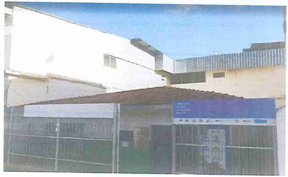
IMAGEM 4: E.M. CLARA DE CASTRO ROGERIO LOCAL: FACHADA LATERAL UBS