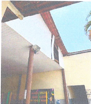
IMAGEM 1: MANUTENÇÃO E. M. MARIA DO CARMO C. CASTRO LOCAL: FORRO - COBERTURA