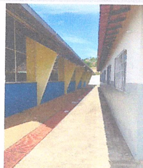
IMAGEM 4: MANUTENÇÃO NAS PINTURAS EXTERNAS