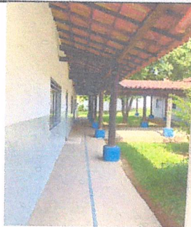
IMAGEM 2: MANUTENÇÃO NAS PINTURAS EXTERNAS