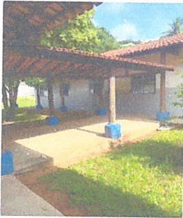
IMAGEM 1: MANUTENÇÃO NAS PINTURAS EXTERNAS