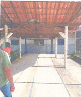
IMAGEM 3: MANUTENÇÃO NAS PINTURAS EXTERNAS