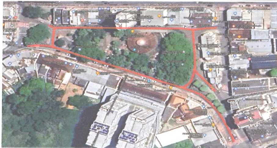
Praça João Pinheiro e trecho da Rua Paschoal Bernardino