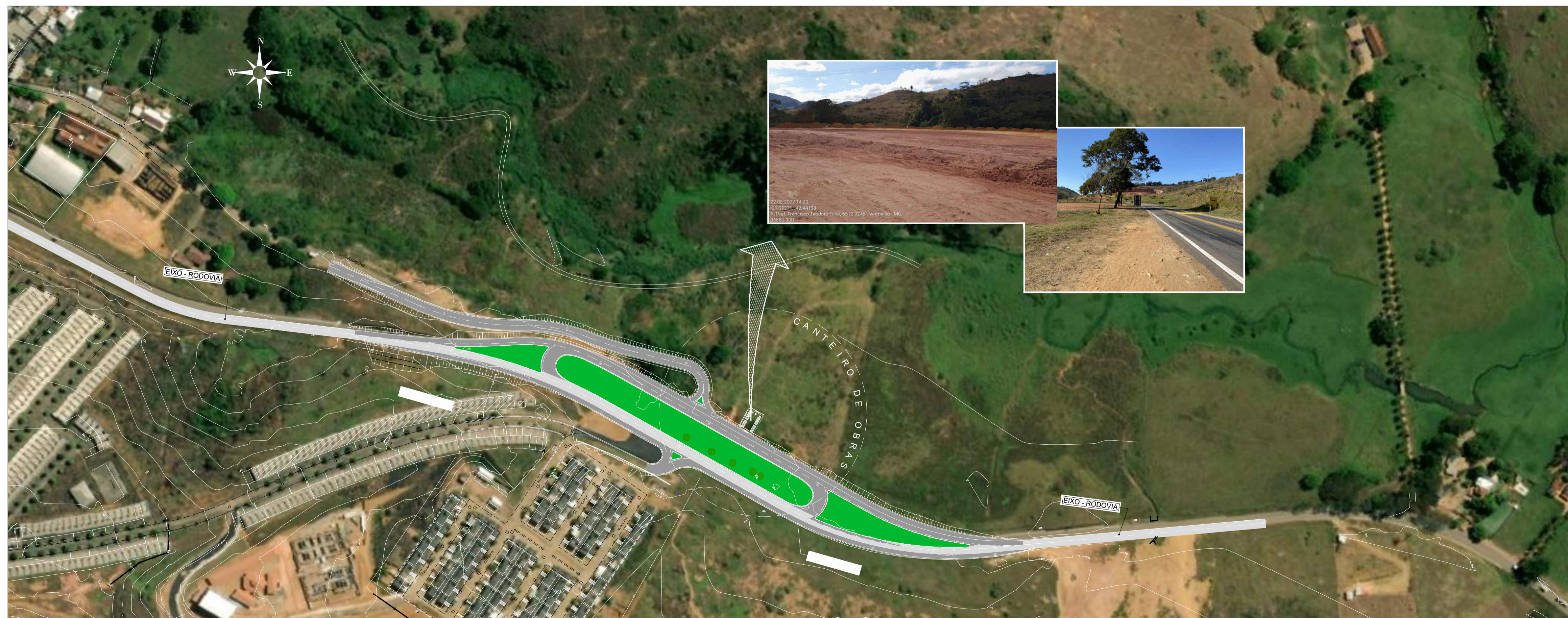
IMPLANTAÇÃO CANTEIRO DE OBRAS ESCALA 1:2000

PREFEITURA MUNICIPAL DE MURIAÉ SECRETARIA MUNICIPAL DE URBANISMO E MEIO AMBIENTE APROVO em 08 de setembro de 2022