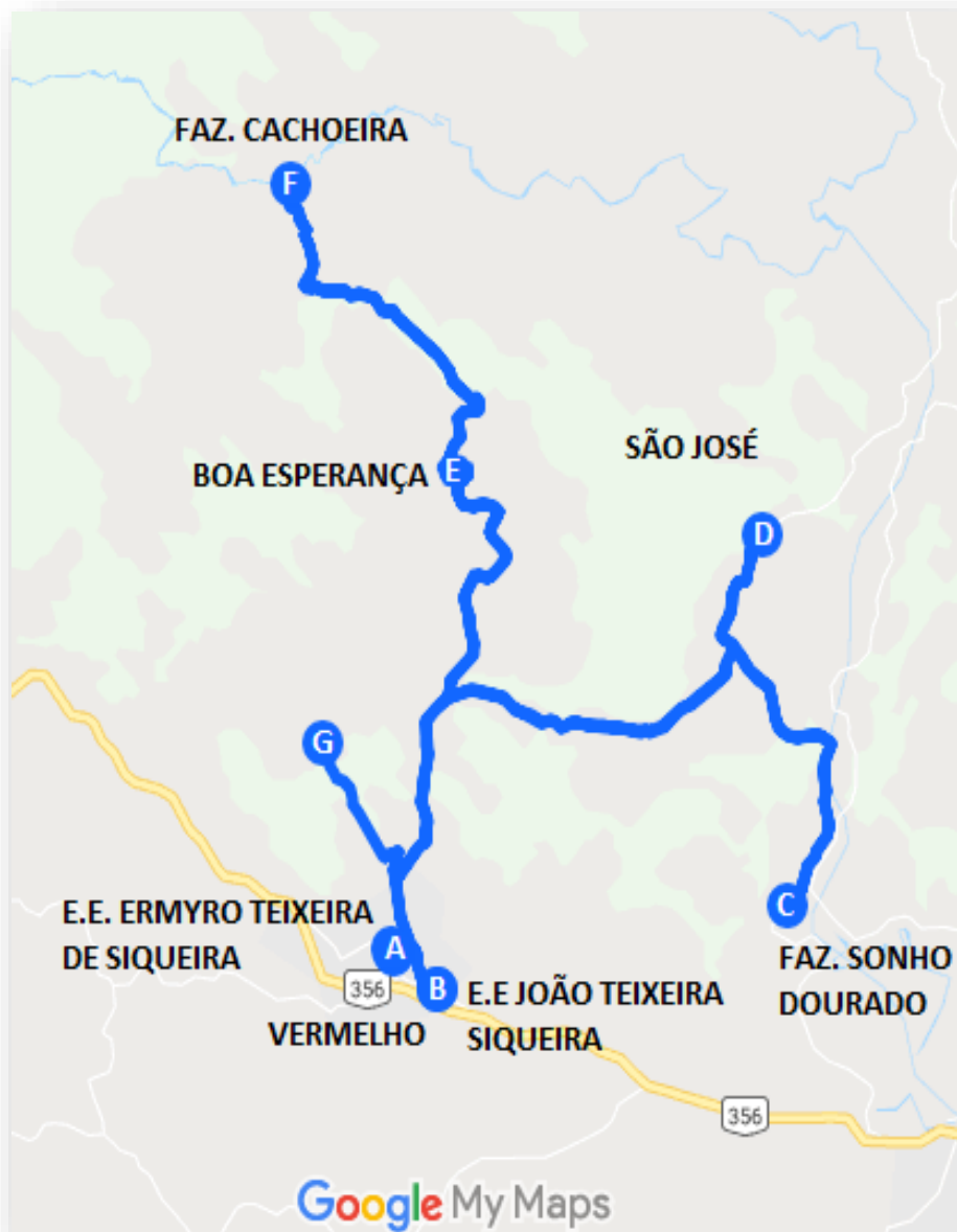
Imagem 1: Projeto Básico da linha Vermelho – Vermelho e São José.