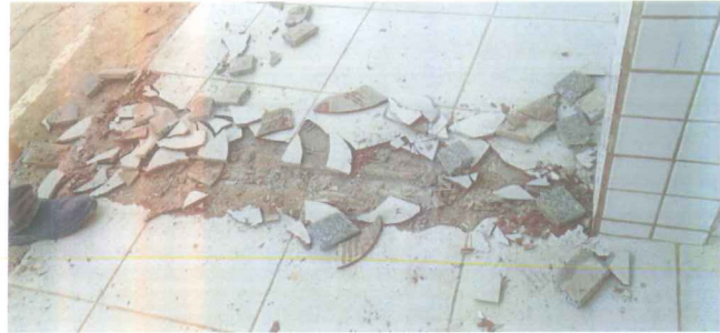
IMAGEM 3: REFORMA DA CAPELA - CEMITÉRIO LOCAL: PISO EM CONCRETO, GUARDA-CORPO

IMAGEM 4: REFORMA DA CAPELA - CEMITÉRIO LOCAL: PISO CERÂMICO, SOLEIRA