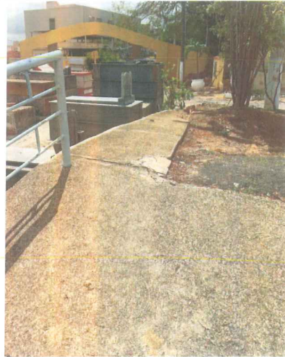
IMAGEM 5: REFORMA DA CAPELA - CEMITÉRIO LOCAL: EXECUÇÃO DE NOVA RAMPA DE ACESSIBILIDADE

IMAGEM 6: REFORMA DA CAPELA - CEMITÉRIO LOCAL: MANUTENÇÃO PASSEIO