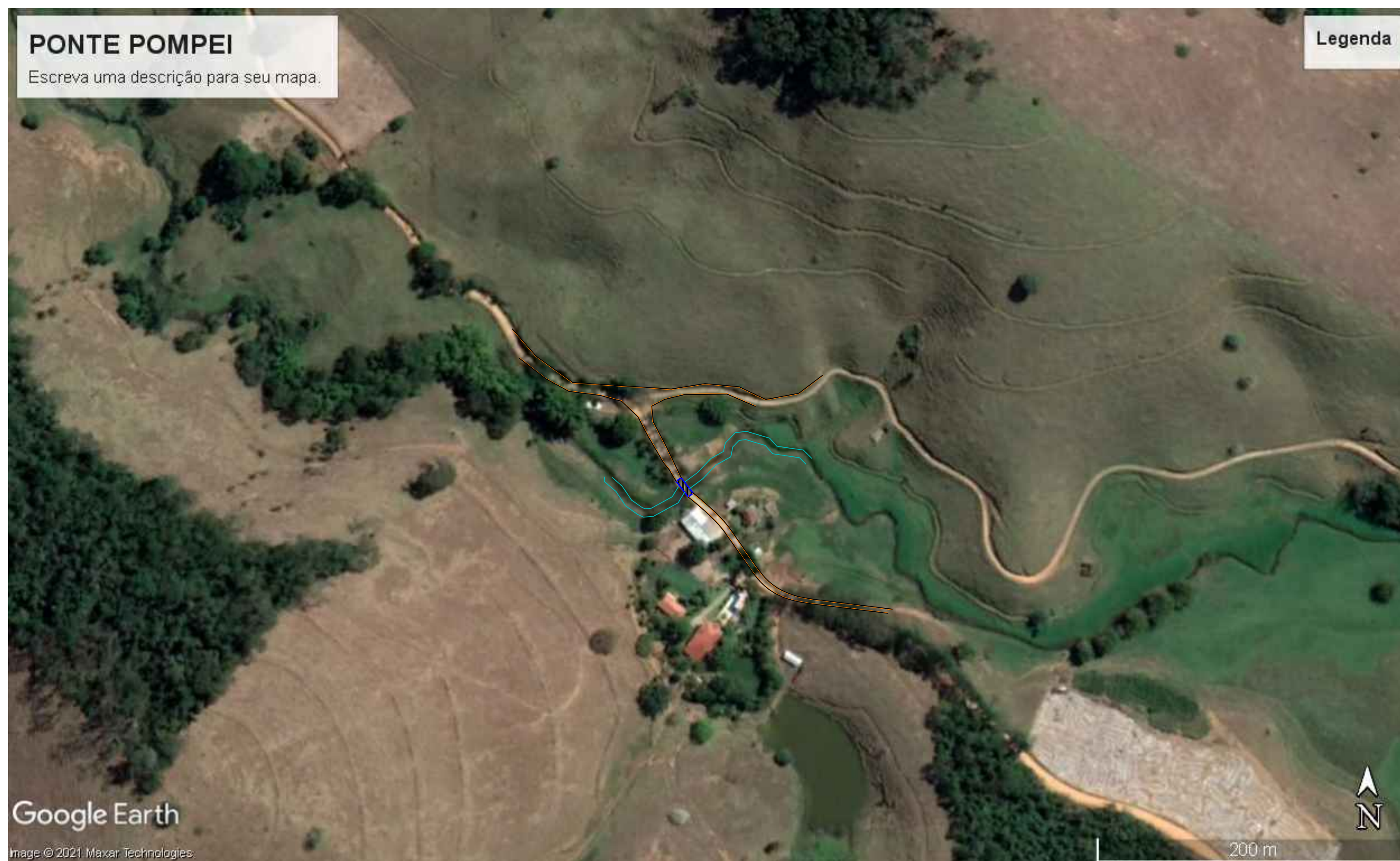
FIGURA 1: VISTA LOCALIDADE DA PONTE SEM ESCALA