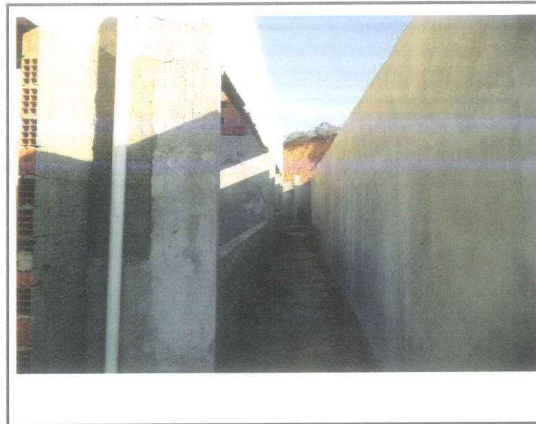
Data que a fotografia foi tirada 22/09/2020