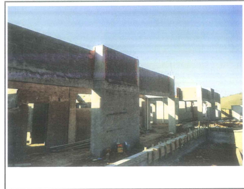
Data que a fotografia foi tirada: 22/09/2020