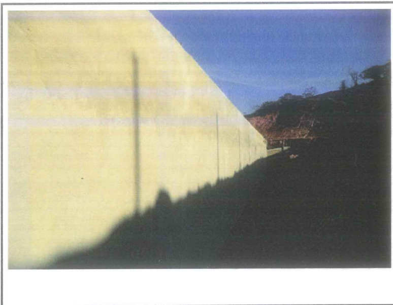
Data que a fotografia foi tirada: 22/09/2020