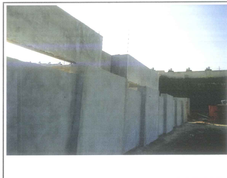
Data que a fotografia foi tirada: 22/09/2020