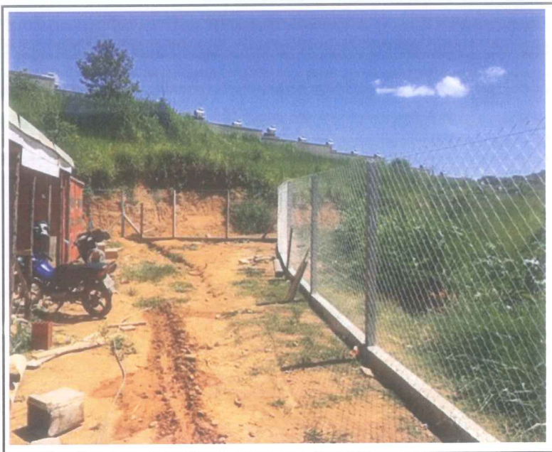
Data que a fotografia foi tirada: 27/01/2021