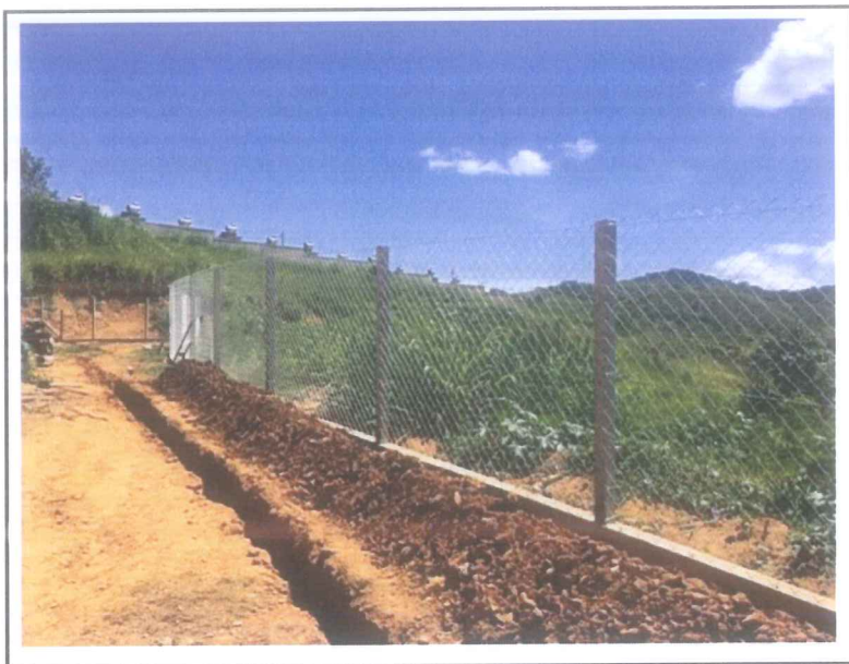
Data que a fotografia foi tirada: 27/01/2021