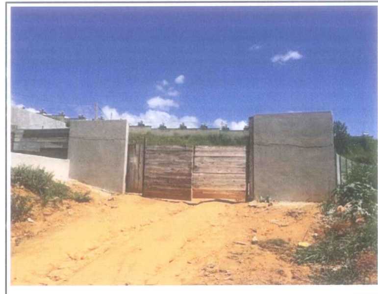
Data que a fotografia foi tirada: 27/01/2021