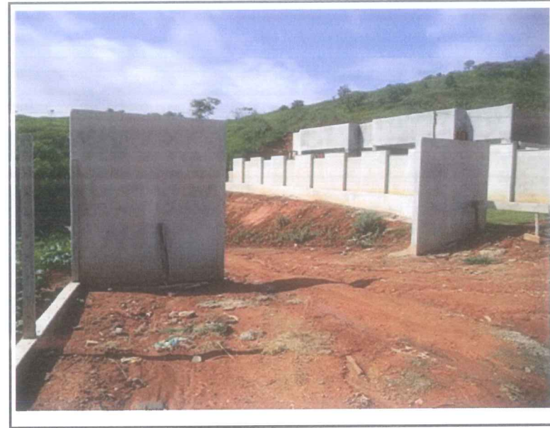
Data que a fotografia foi tirada: 11/01/2021