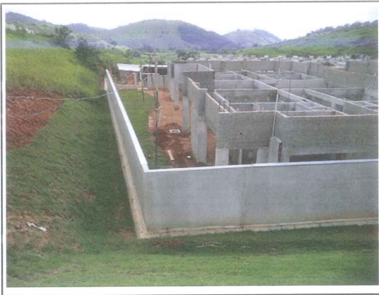
Data que a fotografia foi tirada: 11/01/2021