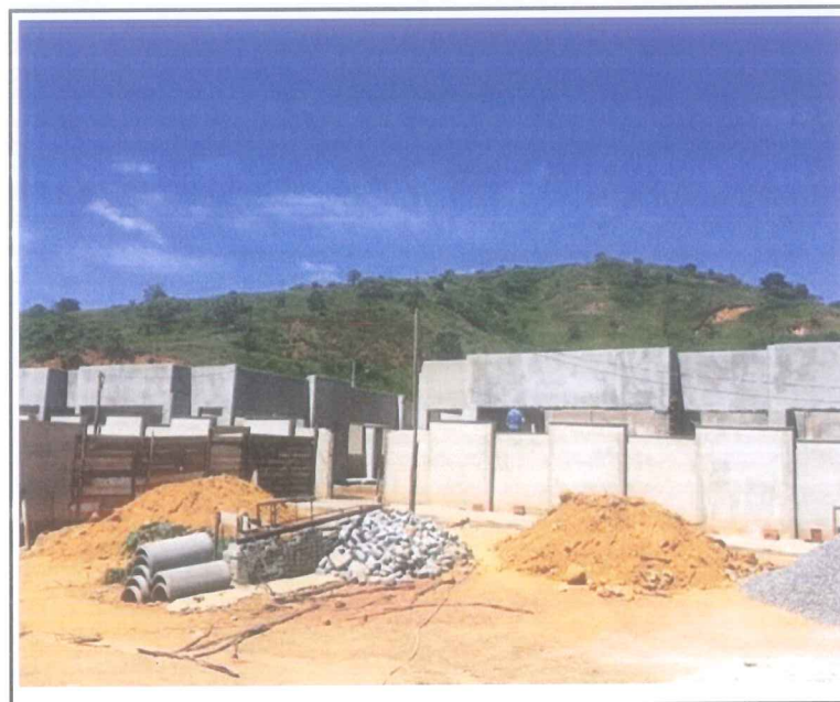
Data que a fotografia foi tirada: 27/01/2021