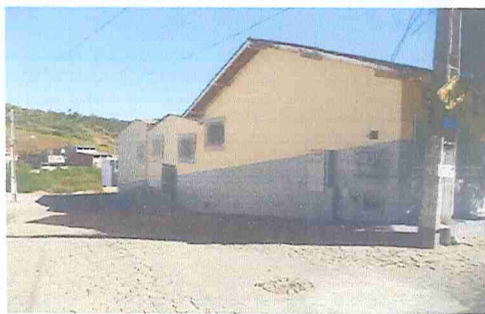
IMAGEM 4: E.M. ERMYRO TEIXEIRA SIQUEIRA LOCAL: FACHADA LATERAL TV. ALMEIDA