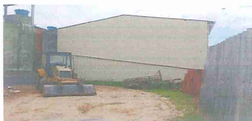
IMAGEM 6: E.M. ERMYRO TEIXEIRA SIQUEIRA LOCAL: FACHADA LATERAL VIZINHO