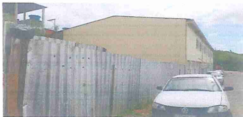
IMAGEM 5: E.M. ERMYRO TEIXEIRA SIQUEIRA LOCAL: FACHADA LATERAL VIZINHO