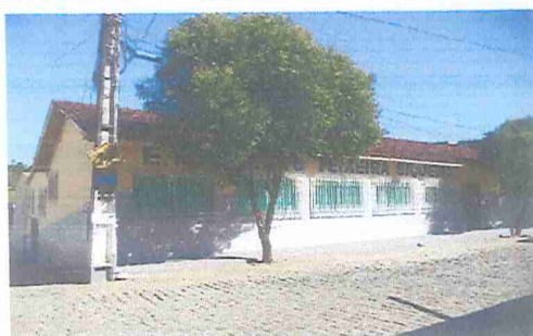
IMAGEM 1: E.M. ERMYRO TEIXEIRA SIQUEIRA LOCAL: FACHADA PRINCIPAL R. PADRE MAXIMILIANO BENASSATI