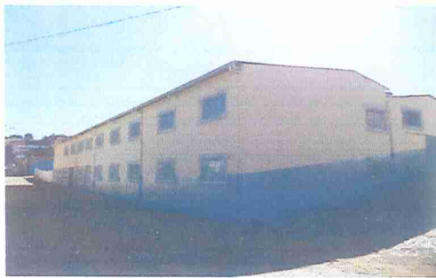
IMAGEM 3: E.M. ERMYRO TEIXEIRA SIQUEIRA LOCAL: FACHADA POSTERIOR