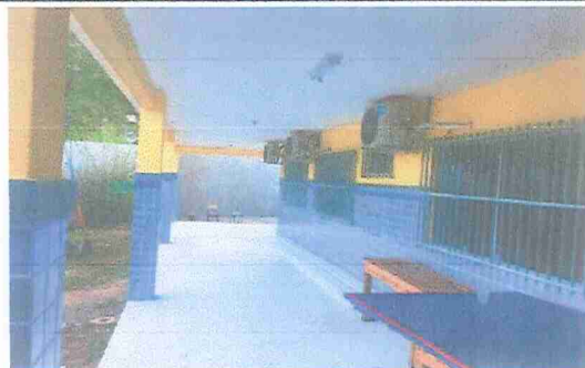
IMAGEM 2: E.M. PROF. IONYR BASTOS DIAS LOCAL: FACHADA PRINCIPAL