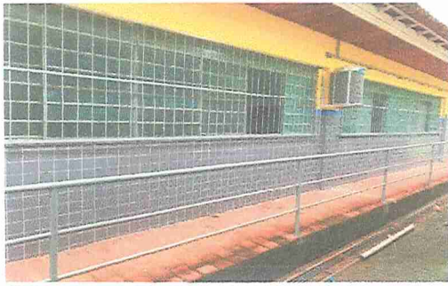
IMAGEM 3: E.M. PROF. IONYR BASTOS DIAS LOCAL: FACHADA FUNDOS