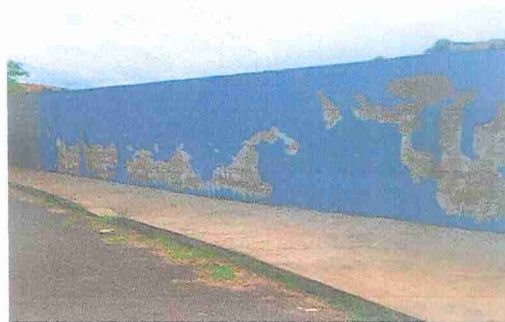
IMAGEM 4: E.M. PROF. IONYR BASTOS DIAS LOCAL: MURO