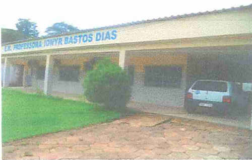
IMAGEM 1: E.M. PROF. IONYR BASTOS DIAS LOCAL: FACHADA PRINCIPAL