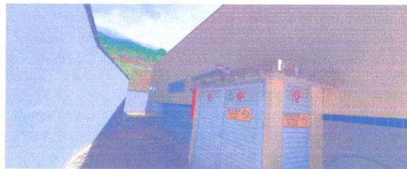
IMAGEM 4: FACHADA LATERAL LOCAL: E.M.ALZIRA CHAVES LACERDA