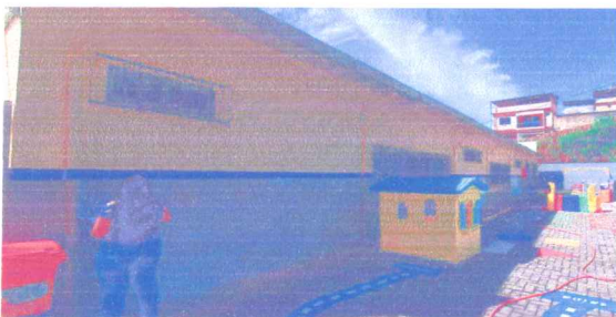
IMAGEM 3: FACHADA POSTERIOR LOCAL: E.M.ALZIRA CHAVES LACERDA