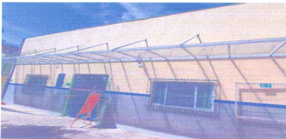
IMAGEM 1: FACHADA PRINCIPAL INTERNA LOCAL: E.M.ALZIRA CHAVES LACERDA