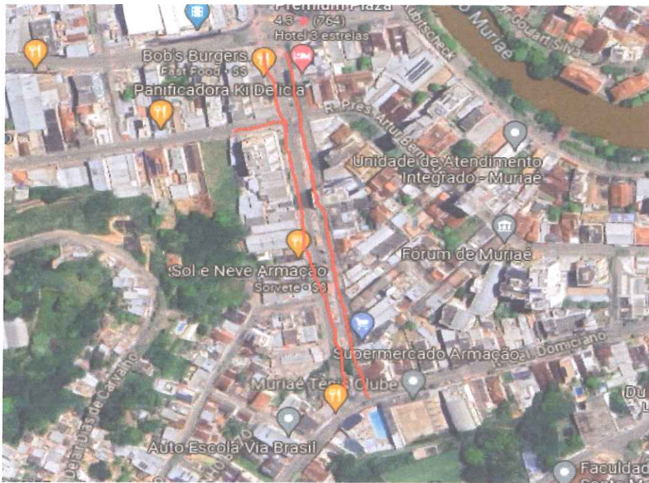
RUA CONSTANTINO PINTO