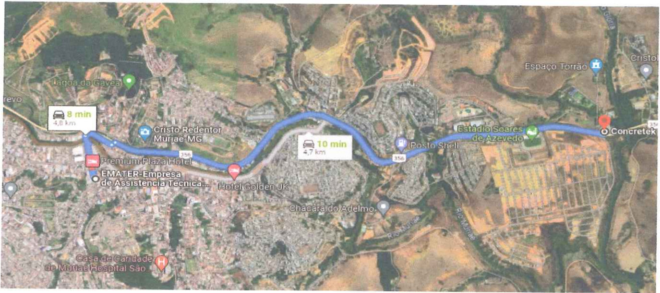
DMT MASSA ASFÁLTICA 4,8 KM