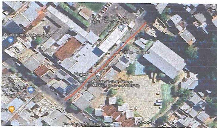
RUA JOSÉ FREITAS LIMA - SAFIRA