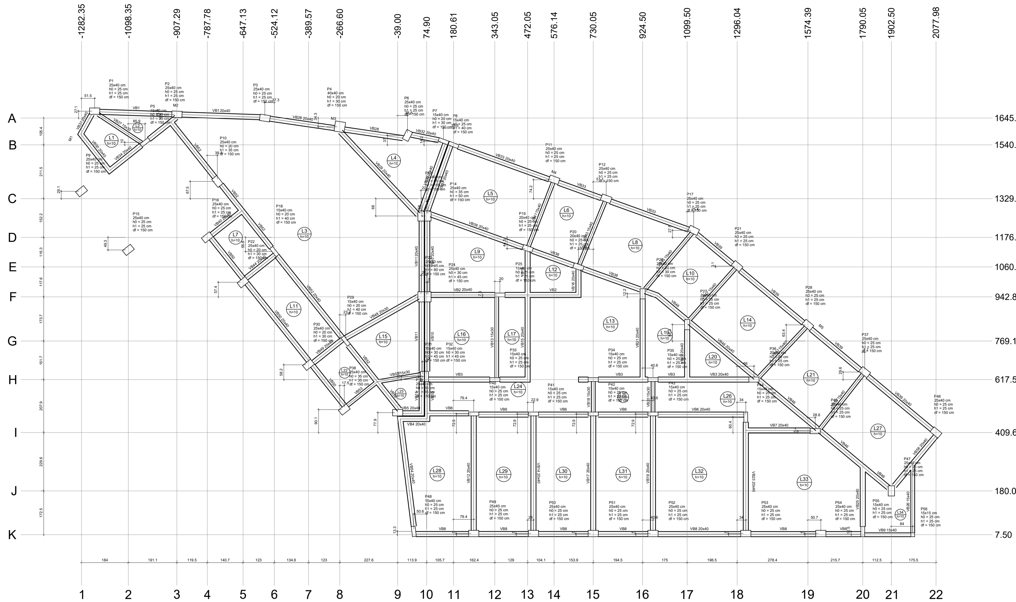
Planta de localização escala 1:75