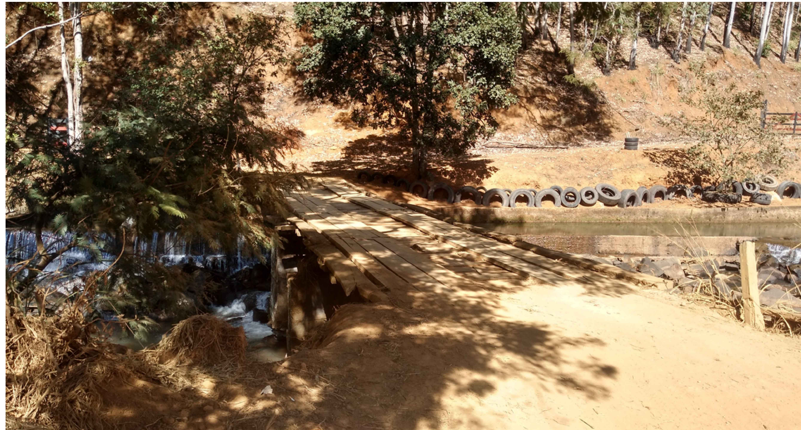
FIGURA 2: FOTO DO LOCAL SEM ESCALA