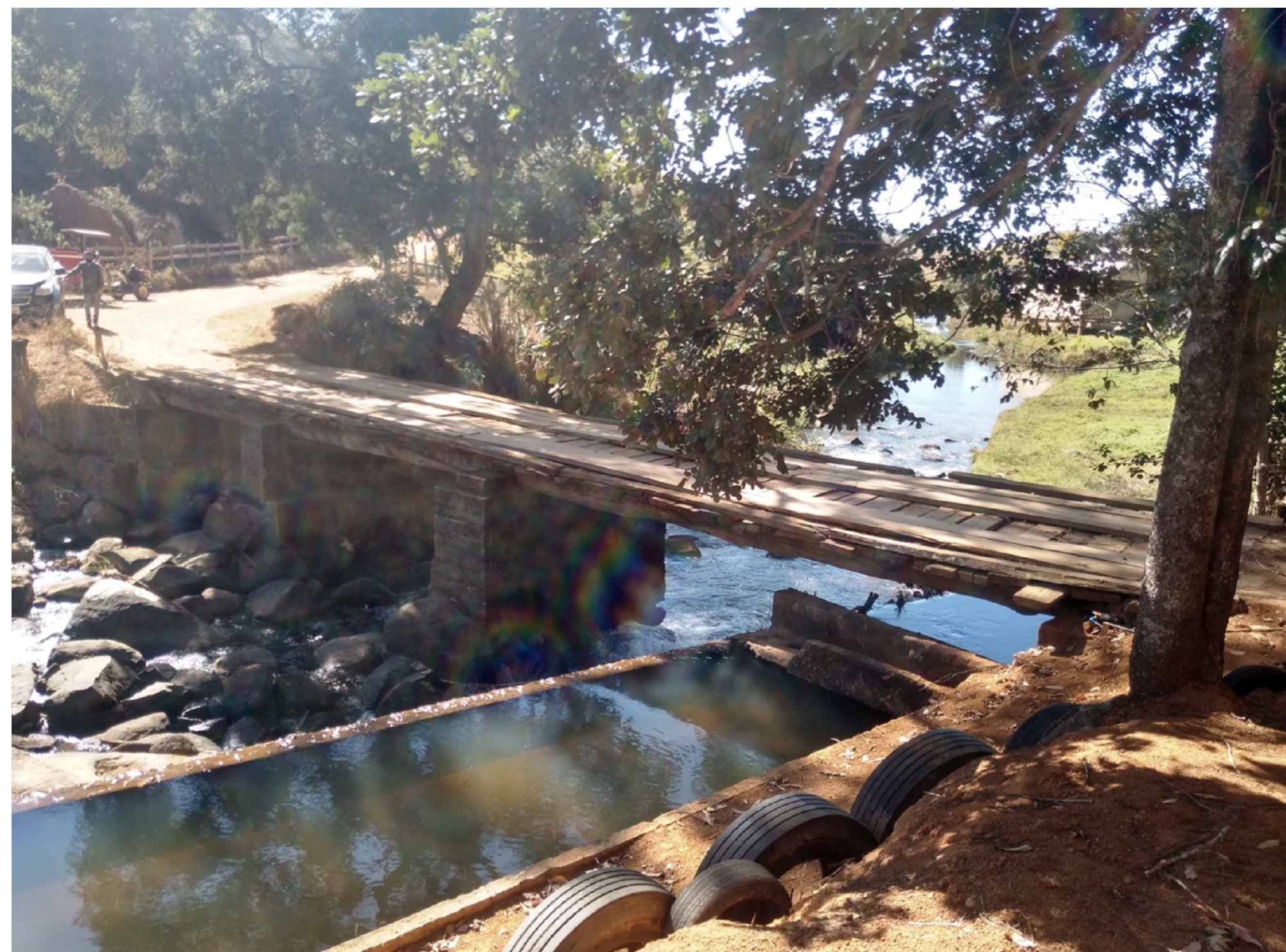
FIGURA 4: FOTO DO LOCAL SEM ESCALA