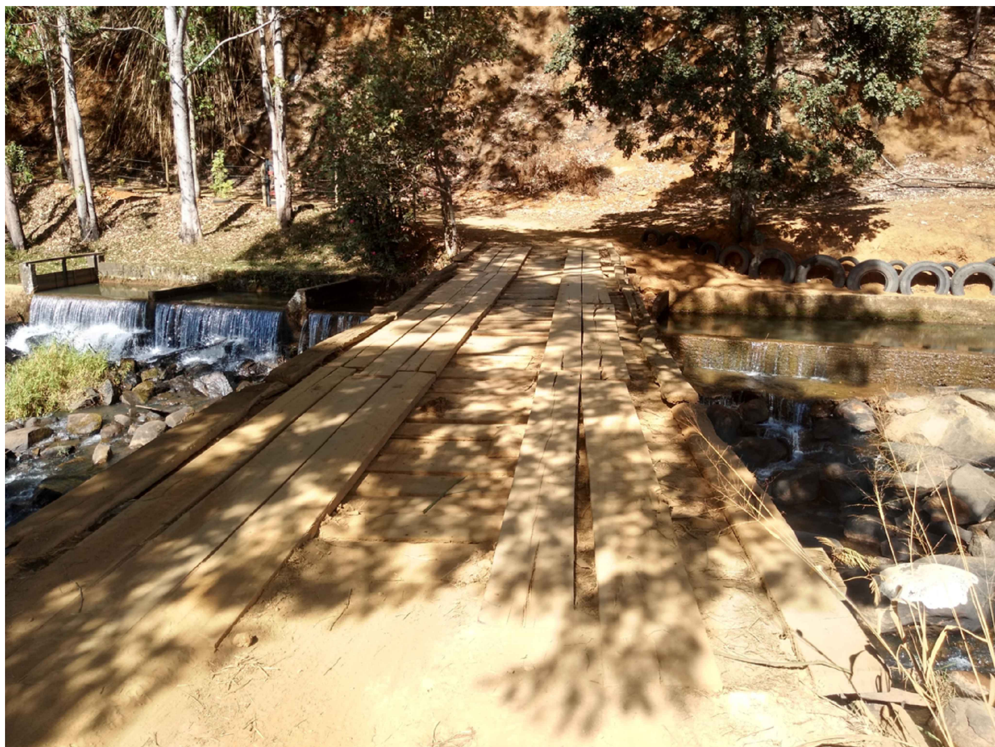
FIGURA 3: FOTO DO LOCAL SEM ESCALA