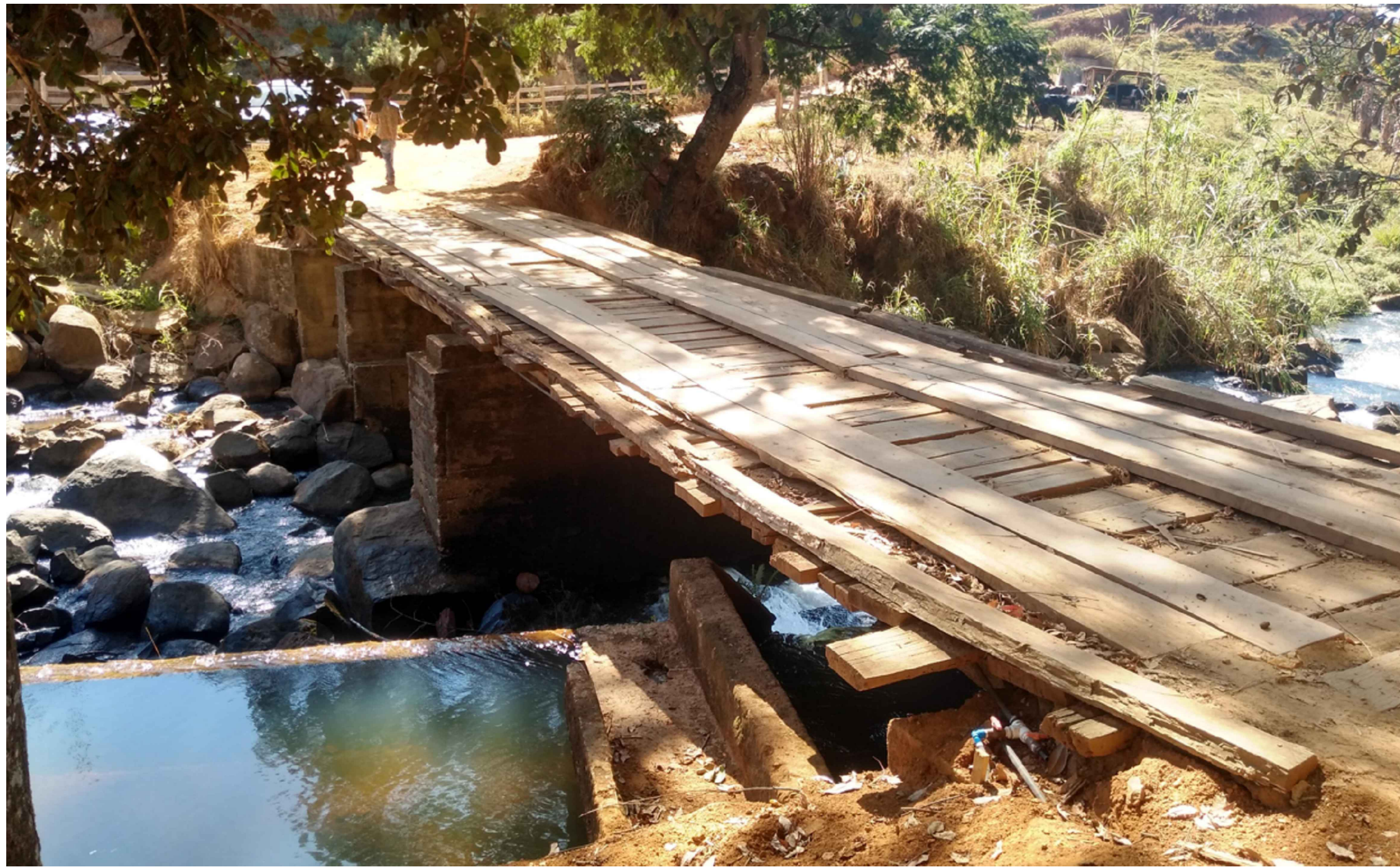
FIGURA 1: FOTO DO LOCAL SEM ESCALA