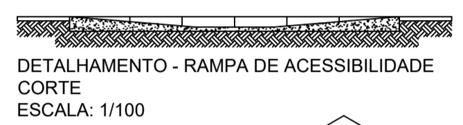
DETALHAMENTO - RAMPA DE ACESSIBILIDADE CORTE ESCALA: 1/100