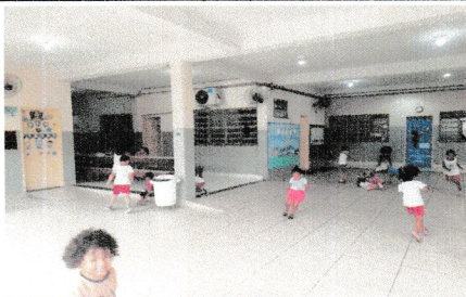
IMAGEM 1: PATIO TERREO LOCAL: E.M. CLARA DE CASTRO ROGÉRIO