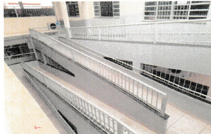
IMAGEM 4: RAMPA LOCAL: E.M. CLARA DE CASTRO ROGÉRIO