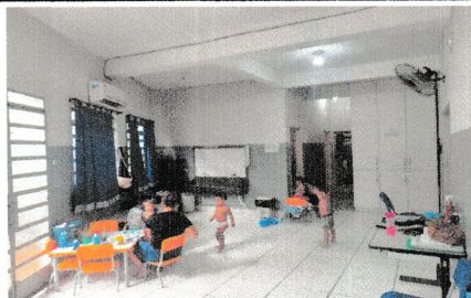
IMAGEM 3: SALA DE ATIVIDADES LOCAL: E.M. CLARA DE CASTRO ROGÉRIO