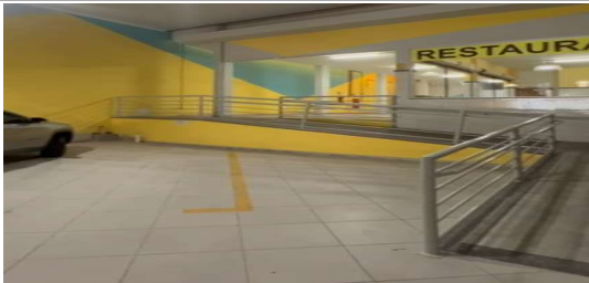
IMAGEM 1: ADEQUAÇÃO RESTAURANTE POPULAR LOCAL: BAIRRO BARRA