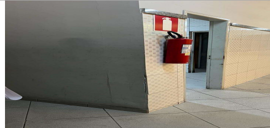
IMAGEM 2: ADEQUAÇÃO RESTAURANTE POPULAR LOCAL: BAIRRO BARRA