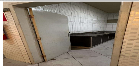
IMAGEM 4: ADEQUAÇÃO RESTAURANTE POPULAR LOCAL: BAIRRO BARRA