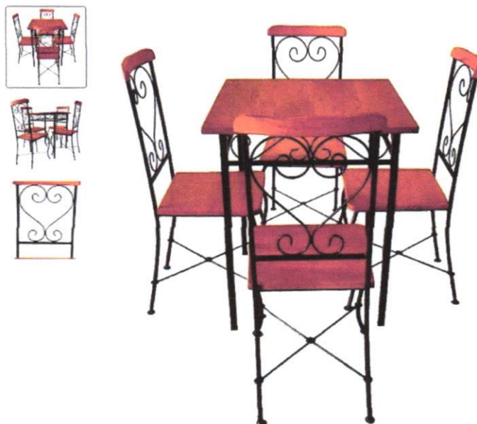
Imagem 01- Mesa quadrada 70x70 cm e 4 cadeiras em ferro e madeira.