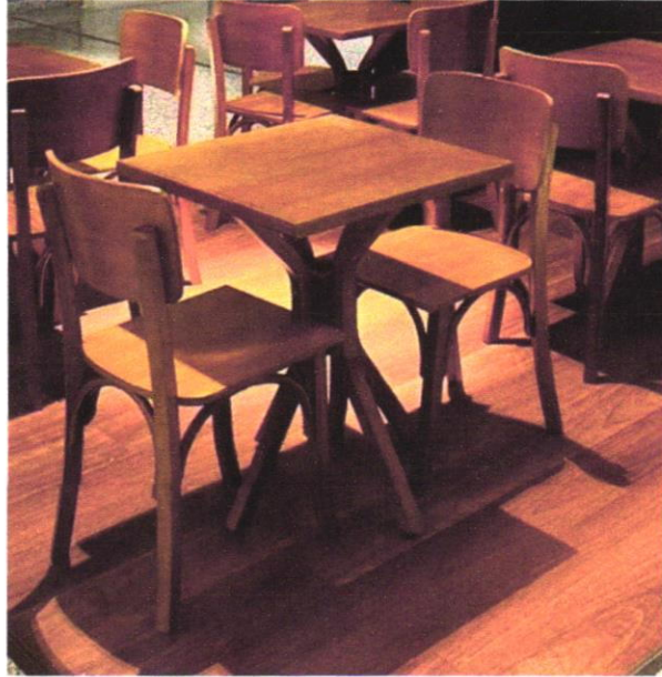
Imagem 03- Mesa de madeira com 4 cadeiras para Bar e Restaurante 70x70 cm.