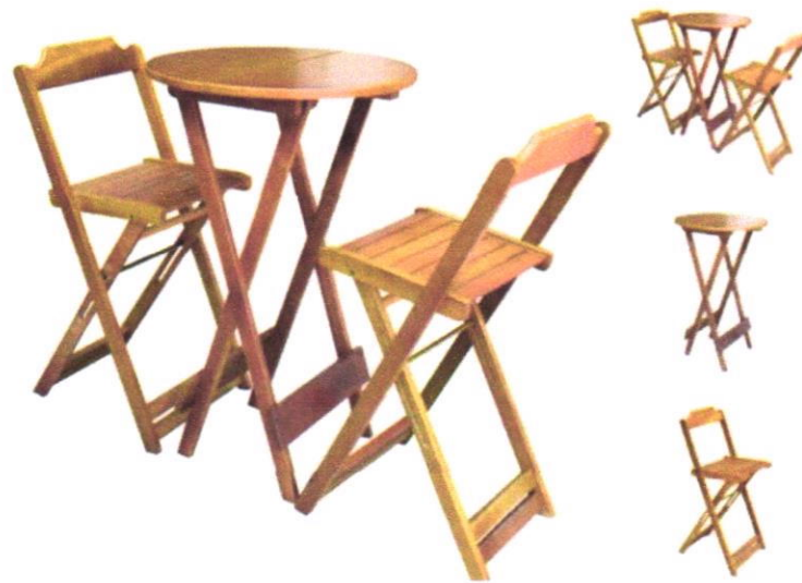
Imagem 05- Jogo de mesa bistrô de madeira com 2 cadeiras dobráveis, ideal para Bar e Restaurante.