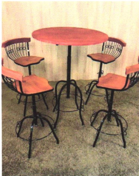
Imagem 04- Bistrô mesa redonda com 4 cadeiras- com regulagem de altura.