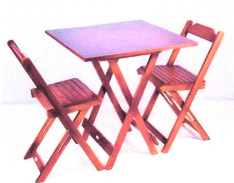
Imagem 02- Conjunto Dobrável 70x70 cm, com 2 cadeiras