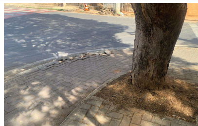
IMAGEM 4: PISO QUEBRADO LOCAL: PRAÇA DOUTOR LISBOA JUNIOR