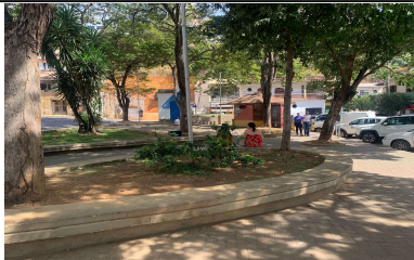
IMAGEM 1: PRAÇA DOUTOR LISBOA JUNIOR LOCAL: BAIRRO CENTRO