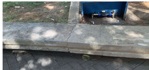
IMAGEM 6: RESTAURO E PINTURA DOS BANCOS LOCAL: PRAÇA DOUTOR LISBOA JUNIOR