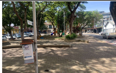
IMAGEM 2: PRAÇA DOUTOR LISBOA JUNIOR LOCAL: BAIRRO CENTRO