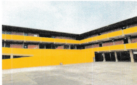
IMAGEM 1: PATIO LOCAL: E.M. GILBERTO BRAZ