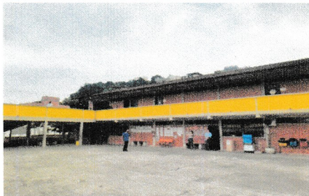
IMAGEM 3: PATIO LOCAL: E.M. GILBERTO BRAZ