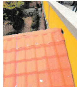
IMAGEM 4: ENCONTRO DE TELHADO COM ALVENARIA SEM MANTA LOCAL: E.M. GILBERTO BRAZ