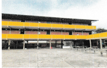
IMAGEM 2: PATIO LOCAL: E.M. GILBERTO BRAZ