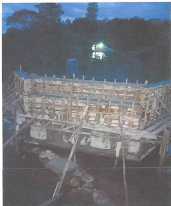
OBSERVAÇÕES: PONTE PEDRA ALTA