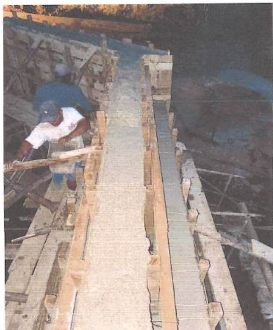
OBSERVAÇÕES: PONTE PEDRA ALTA