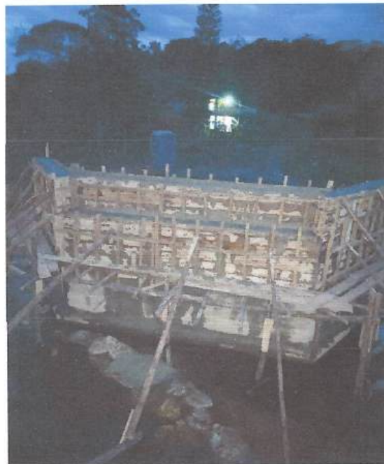
OBSERVAÇÕES: PONTE PEDRA ALTA

Arlando Carmo Mendonça Engenheiro Civil CREA Nº: 177324/D